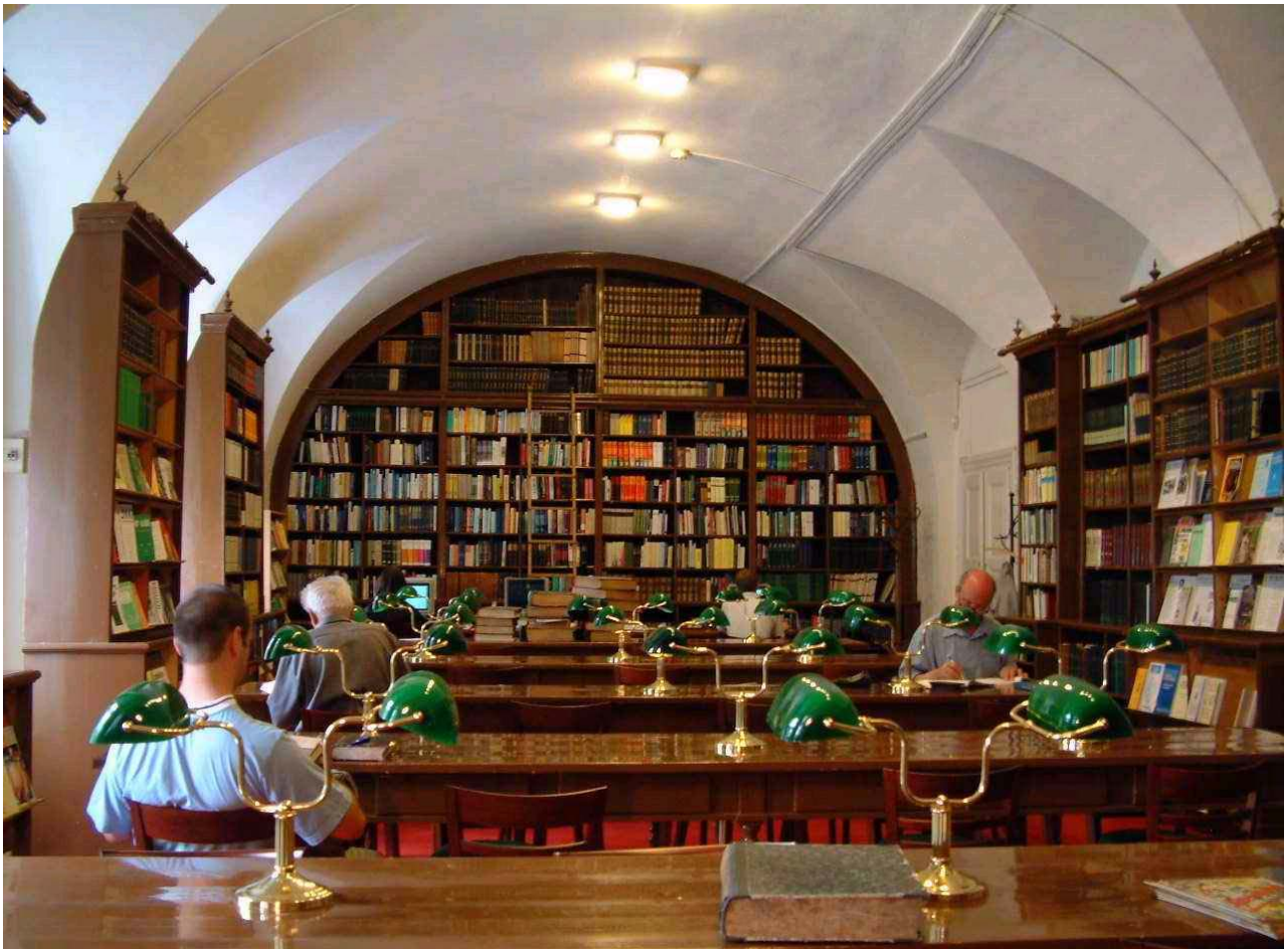
Tiszántúli Református Egyházkerület és Debreceni Református Kollégium Nagykönyvtára

renciákra, szakmai kiadványok megjelentetésére, de retrospektív katalóguskonverzióra is.