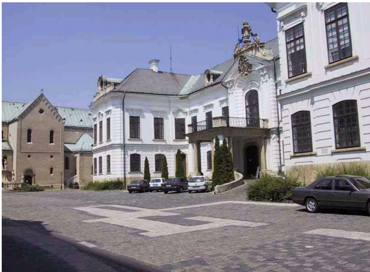
Érseki Könyvtár, Veszprém

tárak, a megyei könyvtárak és természetesen a tagkönyvtárak is.