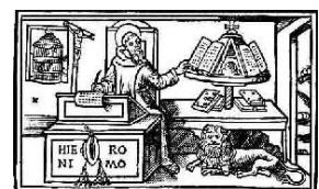
(Szent Jeromos)