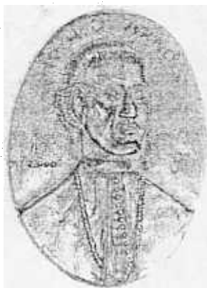
Kő Pál: Ipolyi Arnold (bronzplakett)

A könyvtár munkáját segíti még az 1995-ben alapított Pro Bibliotheca Alapítvány, mely ma már a város kulturális életének is egyik markáns képviselője. Számos kiadványt, kulturális, irodalmi rendezvényt szervez, és még egy Könyvtárért Emlékérmét is alapított (Kő Pál Kossuth díjas