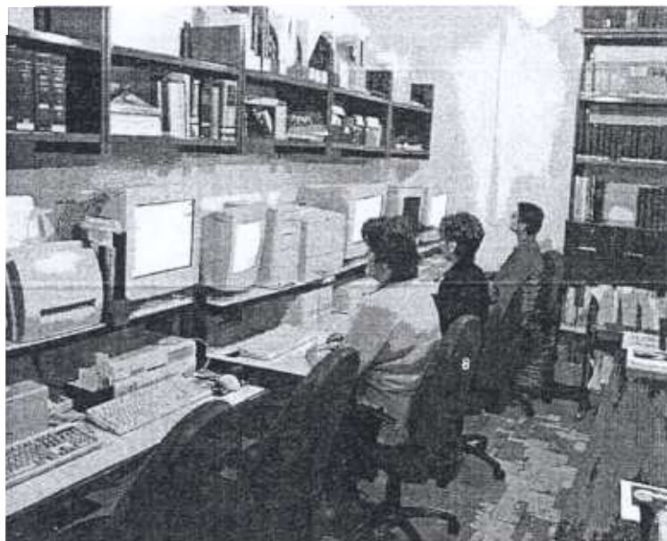
Balra: folyóiratolvasó. Fent: a folyóiratolvasó számítógépsora

A könyvtári gépesítés a nyolcvanas években kezdődött a MicroISIS programmal, amit 1989-ben a magyar fejlesztésű TEXTAR váltott fel.