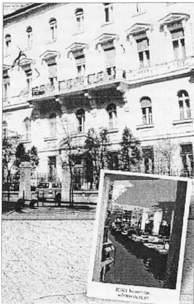
A könyvtár bejárata

A tájékoztató munkatársak mellett tíz számítógép segíti az olvasótermekben a tájékozódást. A számítógépeken lehetőséget adunk az internet,