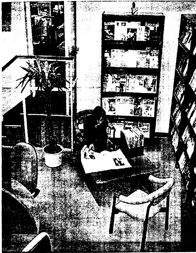
A könyvtár olvasóterme – „folyóirat-olvasó”

szerelese mellett külön figyelmet fordítani ezek kiemelt védelmére. Valamennyi dokumentumunk fel van szerelve vonalkóddal és a lopásgátló rendszer működéséhez szükséges mágnescsíkkal.