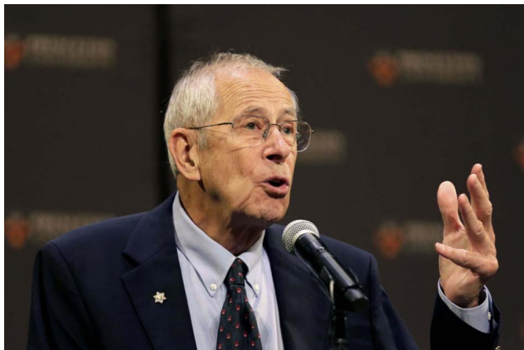
James Peebles, a 2019. évi fizikai Nobel-díj egyik felének kitüntetettje, a Princeton Egyetem professzor emeritusa, a kitüntetés alkalmából – 2019. október 8-án, az egyetemen – tartott sajtókonferencián.

Évezredünk első 20 fizikai Nobel-díjából az ötödiket ítélték oda 2019. október 8-án asztrofizikai felfedezésekért. R. Giacconi (2002, kozmikus röntgenforrások), J. C. Mather és G. F. Smooth (2006, kozmikus mikrohullámú sugárzás feketetest-természete és anizotrópiája), S. Perlmutter , B. P. Schmidt és A. G. Riess (2011, az Univerzum gyorsuló tágulása), K. Thorne , B. Barish és R. Weiss (2017, gravitációs hullám) elismerését követően idén „csak” felerészben jutalmazott a Svéd Akadémia égbolton végzett megfigyelésekkel elért felfedezéseket ( M. Mayor és D. Queloz munkáját önálló cikk mutatja be). A 2019. évi fizikai Nobel-díj felét James Peeblesnek ítélték.