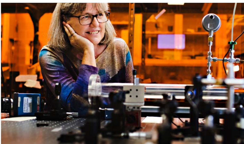
a University of Waterloo Nobel-díjas professzora.

sített rácsos kompresszorral időben összenyomták. Ezzel az eredeti impulzus energiáját 250-szeresre növelték, míg időbeli hosszát egy ps alá vitték (0,7 ps).