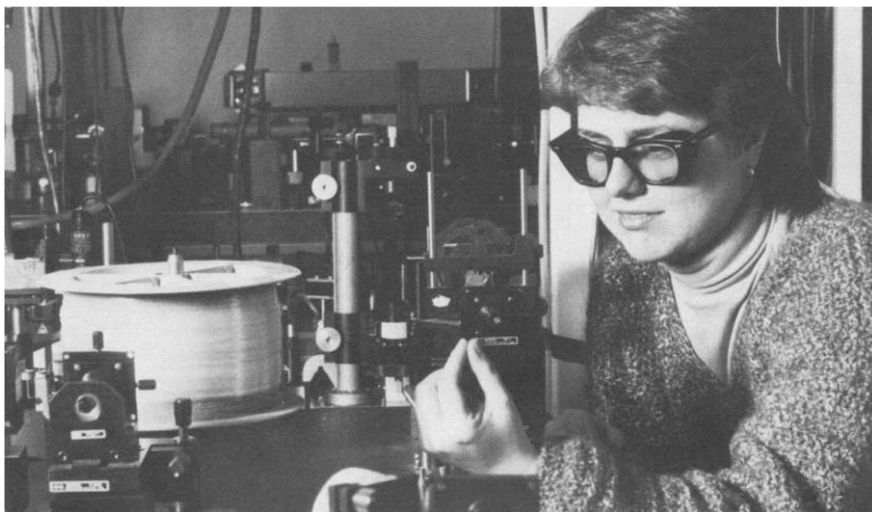
Donna Strickland, a Rochesteri Egyetem végzős hallgatója és

Nem úgy, mint Jénában. A Friedrich Schiller Universität Berdt Wilhelmi által vezetett kutatócsoportja 1985 áprilisában egy kísérletet publikált [5], amelyben egyetlen optikai szál segítségével egyrészt spektrálisan kiszélesítették a ps-os impulzusokat (nemlineáris fázismodulációval, mint a kortárs kutatócsoportok), valamint egyúttal időben is megnyújtották (lineáris diszperzió). Ezen impulzusokat azután egy erősítőn átvezetve megerősítették, majd a végén egy egyszerű-