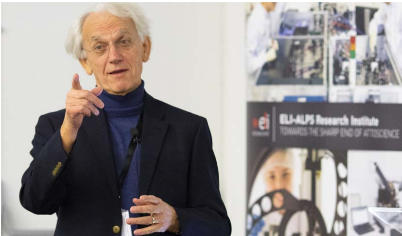
előadást tart 2018. november 14-én a szegedi ELI-ALPS-ban.

Mi több, egy új nevet, „fázismodulált impulzus erősítés” (chirped pulse amplification, CPA) adtak az eljárásnak, amit egyébként az általánosítás során a radar-technológiára vezettek vissza. A Bell Laboratórium-ból eredő „chirp” kifejezés ( chirp , ami magyarul csicseregést jelent) a radarimpulzus fázisának modulálását, azaz a frekvencia időbeli folytonos változtatását jelenti [7], és az akusztikai analógiában madárfüttyre emlékeztető hanghullámra utal. Optikai impulzusban is létrehozható ez a csőrp, azaz fázismoduláció, például, ha az egyes frekvenciakomponensek különböző terjedési sebességgel rendelkeznek, vagy különböző hosszúságú utakat futnak be a terjedés során. Előbbi a természetben adott, hiszen a törésmutató hullámhosszfüggése, azaz a normál diszperzió miatt a „vörös” spektrális komponensek sebessége nagyobb a „kék” komponenseknél. Ennek fordítottját, azaz a kék komponensek gyorsabb terjedését a látható tartományban nem a sebességek különbségével, hanem a terjedési utak különbözőségével lehet elérni – mint például a Treacy-féle kompresszorban [2]. A fázismodulációval akár több ezerszeres időbeli nyújtás is elérhető, amivel az impulzusok csúcsteljesítménye arányosan lecsökken. Ennek köszönhetően az erősítés során elkerülhető az önfokuszálódás és a