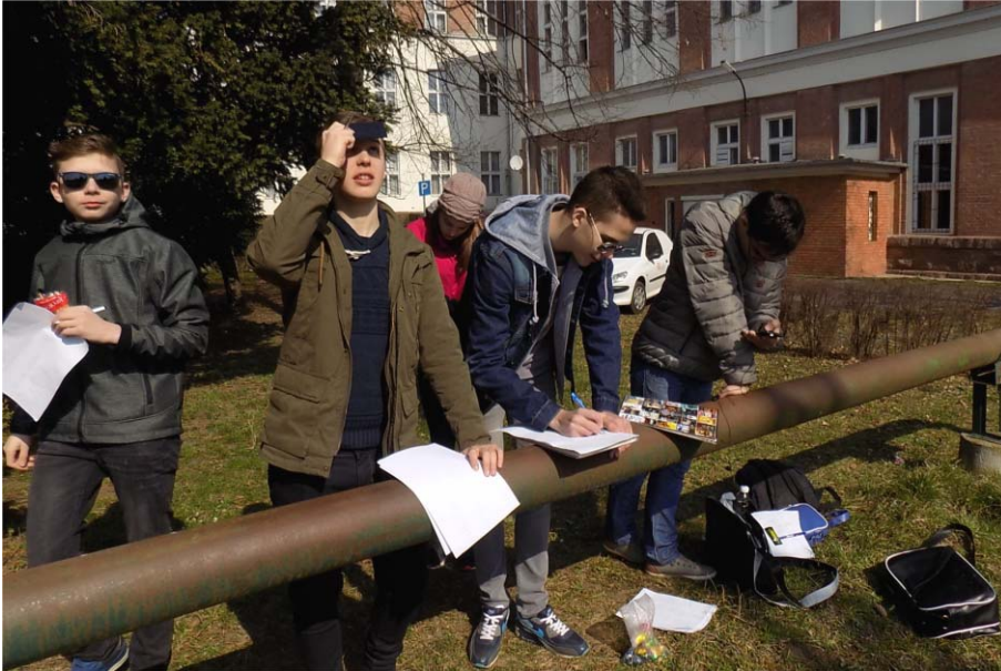
1. ábra. A környezet változását figyelő diákok csoportja.

mata és a hőmérséklet változása között. Jól látszik tehát, hogy van mire építenünk, így nincs más dolgunk, mint az itt említett fogalmakat tehetséggondozó szakköri foglalkozás keretében a fizikai tartalmakat előtérbe helyezve felidézni, kiegészíteni, és a nap-sugárzásra vonatkozó ismereteket bevonjuk a fizika-tantárgy menetébe.