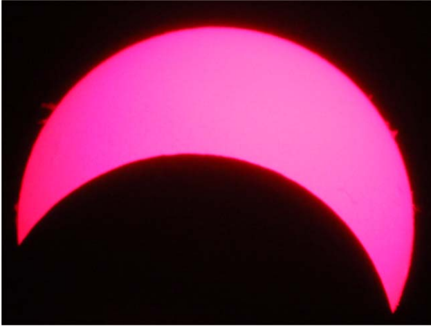
3. ábra. Hidrogén-alfa fényben készült felvétel a jelenségről. A napkorong szélén protuberanciák is megfigyelhetők.

Néhány diák saját hőmérővel is dolgozott, az ő mérési adataikat is rögzítettük a jegyzőkönyvben. Ezzel is hangsúlyoztuk, hogy tudományos jellegű méréseket nem csak laboratóriumi eszközökkel és körülmények között lehet végezni.