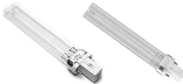
2. ábra. A kísérlethez ajánlott kompakt fénycső.

2. Töltsük fel a frissen csiszolt cinklemez a macskaprémel megdörzsölt ebonitrúddal negatívra! A ger-