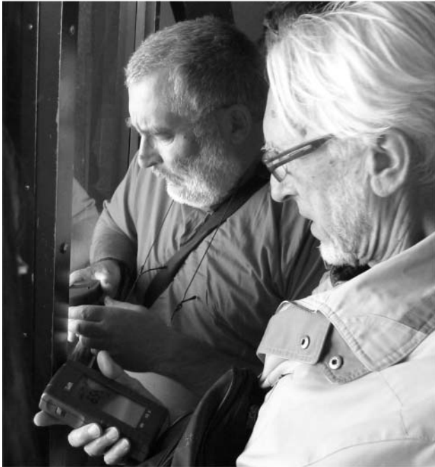
2. ábra. Egyidejű légnyomásmérés és helymeghatározás a felvonókabin ablakánál a pontos magasságmeghatározás érdekében.

monix, 16,4\text{ }^{\circ}\text{C} , a csúcson 9,3\text{ }^{\circ}\text{C} . Ez azonban a termodinamikai hőmérsékletskálán ( T ) csak körülbelül 2% változásnak felel meg, így az izoterm közelítéssel nem követünk el súlyos hibát.