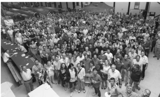
7. ábra. Az új bozon felfedezését ünnepli az ATLAS-együttműködés.

udvariasan kiüríteni az épületet. Senki sem mozdult... Egy perc múlva tűzoltók jöttek, gázmaszkban. Fényképezőgépek villogtak, de a sor rendületlenül állt. Egy idő után egy biztonsági is elővette a fényképezőgépét és többünk multságára immár ő fényképezett minket. A hangulat, különösen a korai órára való tekintettel, kissé szürreális volt. A fülrepszto sziréna végül elhallgatott. A gázmaszkos tűzoltók elmentek. Mi pedig találgattuk: „Talán egy későn érkező próbált (hiábavalóan) kedvezőbb pozícióba kerülni?”