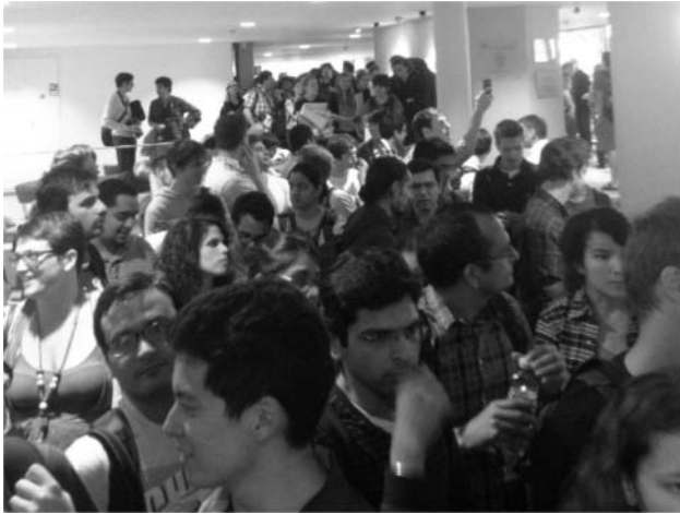
6. ábra. A hosszú sor. Várakozás a történelmi Higgs-szemináriumra a CERN folyosóin 2012. július 4-én.

A rengeteg munka, az életteli viták végül meghozták gyümölcsüket. Az ATLAS- és CMS-detektorokkal sok-sok fizikus, mérnök és ki tudja mennyi különböző foglalkozást űző szakember munkáját dicsérve, egymástól függetlenül felfedeztünk egy új részecskét, egy bozont (azaz egész spinű részecskét), amely tulajdonságaiban nagyon hasonlít az oly sokáig keresett Higgs-bozonra. Csak több adat és további gondos analízis döntheti el, vajon tényleg rá vagy egy hasonmására akadtunk.