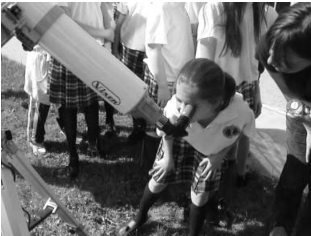
1. kép. Égi tünemény földi megfigelője.