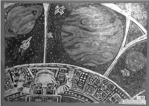
3. kép. A rajzpályázat győztes alkotása.