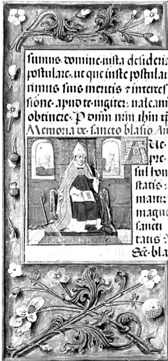
14. századi kézírásos műkönyv egyik oldala (Bruckenthal Múzeum)

den rend, lovag- vagy szerzetesrend figyelmét arra összpontosíthatja, hogy miként érvényesül a tartományi jog, és hogyan folynak az ügyek a saját osztályába tartozó emberek körében, feltéve, hogy nem gyakorolja s nem bitorolja a szokványos hatásköröket. A tartomány eme tagjainak gyűjtőneve Németországban die Stende der Landschaft 8 .