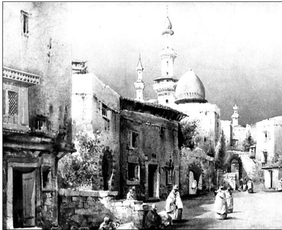
A régi Isztambul

A romániai utazások megsokasodtak, nyaranta hazalátogattak Kolozsvárra, Nagyenyedre, Nagyszebenbe.