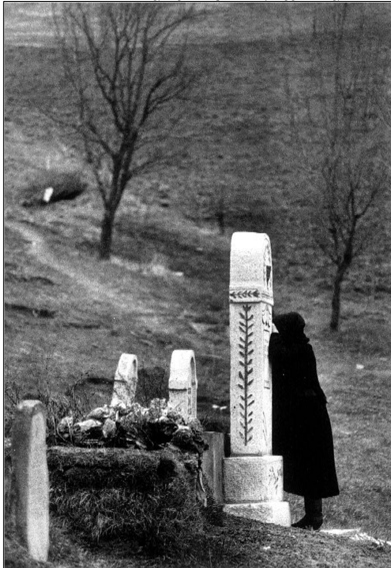
A símál

sokkal. Úti célunk, az impozáns, barokk kapus temető a város szélén fekszik, a „Junger Wald” tőzomszédságában és a néhai szászok kedvenc kirándulóhelye. Széles fősétányát valamikor hűvös árnyú hársfák szegélyezhették, de mára már csak néhány korhadó tuskó tanúskodik erről a „régicdőségről”. Itt is rekkenő a hőség. A temető csendes. (Mindig ez az érzés, igen, a nemlétezés, a megsemmisülés és a céltalanság érzése fog el, ha belépek egy temetőbe.) A betonlappal lezárt sírok márványtömbjei között olykor félszékely egy-egy „anyaországából” visszatért, fonnyadt virágcsokrot szorongató öreg szász remegő alakja.