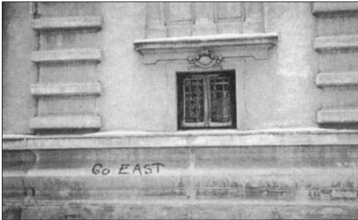
A Secolul XX. folyóirat Bukaresttel foglalkozó számának illusztrációja

sadalmában éljenek, akkor egy felháborított idősebb olvasó válaszában szükségesnek tartotta, hogy barátom (véleményem szerint józan) érveit a nyugdíjasok fizikai kiirtásának intencióival vádolja meg!!! Most meghaladhatjuk a román társadalom e lényeges problémájának primitív tárgyalási szintjét. Úgy gondolom, komoly lehetőségek nyílnak a mentalitás, a szocializációs módok és színtek, a munkaerőpiac dinamikája, a politikai kultúra, az „ifjúság” identitása alakulásának kutatására – olyan kutatásokra, amelyek nélkülözhetetlenek a hosszabb távra végiggondolt, „eurokonform” eszméket és attitűdöket gerjesztő, megalapozott politikákhoz. Ha most gyorsan levonnánk a következtetéseket arról, hogy milyenek a „fiatalok”, akkor elvesztenénk minden esélyünket arra, hogy megértsük: 1. valójában nem sokat tudunk róluk, és 2. nem szükségesszerű az a spontán társítás, amely a politikai közösség legújabb tagjai és a közbeszédben feltűnő legújabb eszmék (a diszkrimináció összes formáinak elutasítása, az egyéni, valamint más jellegű – helyi és regionális – autonómiák garan-