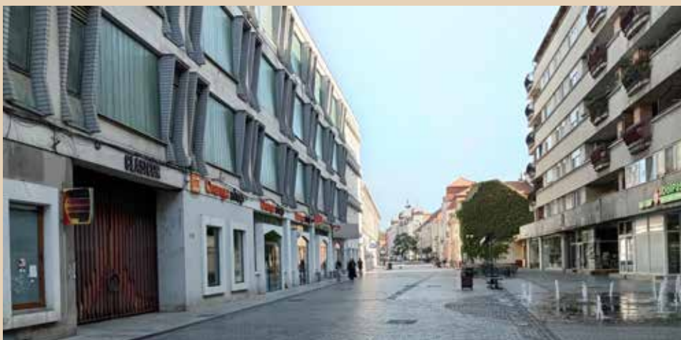
Kép és szöveg: Farkas László

RÉGEN ÉS MOST ● A váradi Fő utca felső szakaszának képei nagy változást mutatnak! A régi fotón barátságos, földszintes épületeket látunk, üzlethelyiségekkel, míg a mai képen a helyükbe épített tájidegen gyármonstrumot és blokkházat.