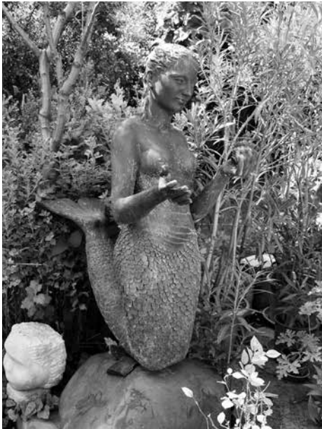
A művész kertjében

– A kiállítások fontosak? Legutóbb Tamásiban mutatta be a munkáit. Hány tárlata volt eddig?