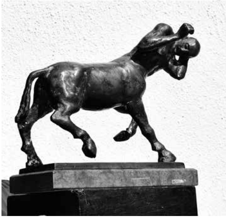
Egy jellegzetes, gondolatközvetítő Adorjáni-szobor

való taníttatásának biztosítása volt. (Mindenki tudja, hogy Ceaușescu Romániájában milyen állapotok uralkodtak.) A visszajárás oka pedig a szülőföld vonzása, a rokonok látogatása. Nagy a család, öten vagyunk testvérek, édesapám és édesanyám is református lelkész volt. Kaptunk tőlük útravalót, hitből, magyarságból, emberségből.