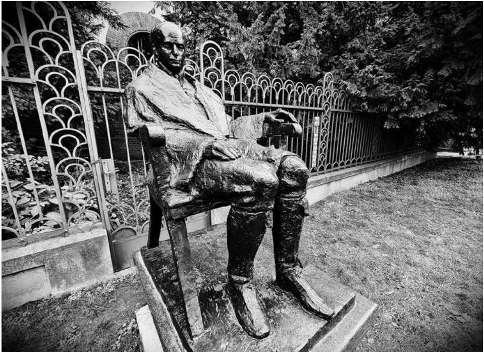
Kőrösi debreceni szobra