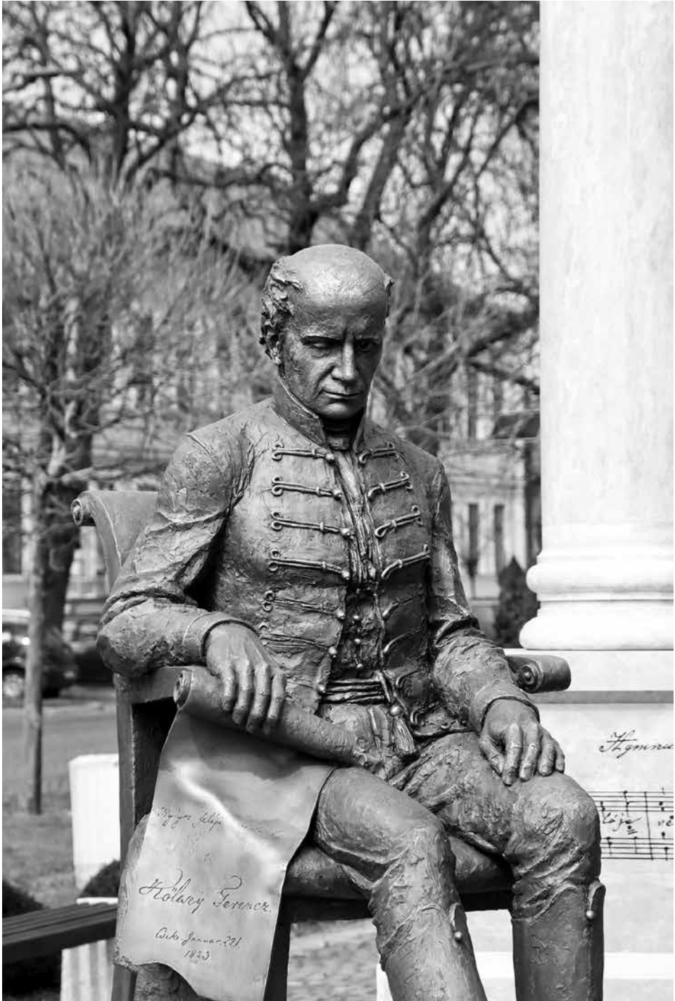
Kölcsey Ferenc ülőszobra – bronz, süttői mészkő; Nagykároly, 2023 – részlet