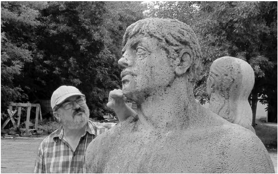
A művész Borsos Miklós restaurálásra váró szobrával a ladányi műterem udvarán

és ez meghatározta a pályaválasztásomat. Jelentkeztem Budapestre, és felvettek a „kisképzőbe”. Ez volt a Képzőművészeti Főiskola előszobája. Először üvegyári rajzoló szakon kezdtem, mert arra gondoltam, ha elvégzem, elhelyezkedem az üvegyárban Berekfürdőn, de a második félévet már szobrász szakon folytattam. Itt a kollégiumban hasonlórú gyerekekkel kerültem egy közösségbe. Hasonlóan vélekedtünk a művészetről és a világ dolgairól. 18 évesen, amikor 200 éves volt a gimnázium, közel tíz szobromat állították ki a Műcsarnokban az évfordulón. Háromszor felvételiztem a Képzőművészeti Főiskolára. Mind a háromszor a maximális 20 pontot értem el. Hátránynak bizonyult azonban, hogy édesapám nem volt párttag, és volt, aki felemlgette, hogy egy családból két szobrász nem lehet. Nem lett igaz! Harmadik nekifutásra felvettek. Talán azért, mert a jó Isten azt akarta, hogy Borsos Miklós legyen a meste-