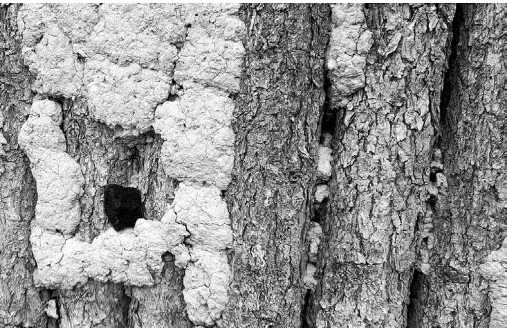
Áldás, 2022, Ulánbátor, Mongólia