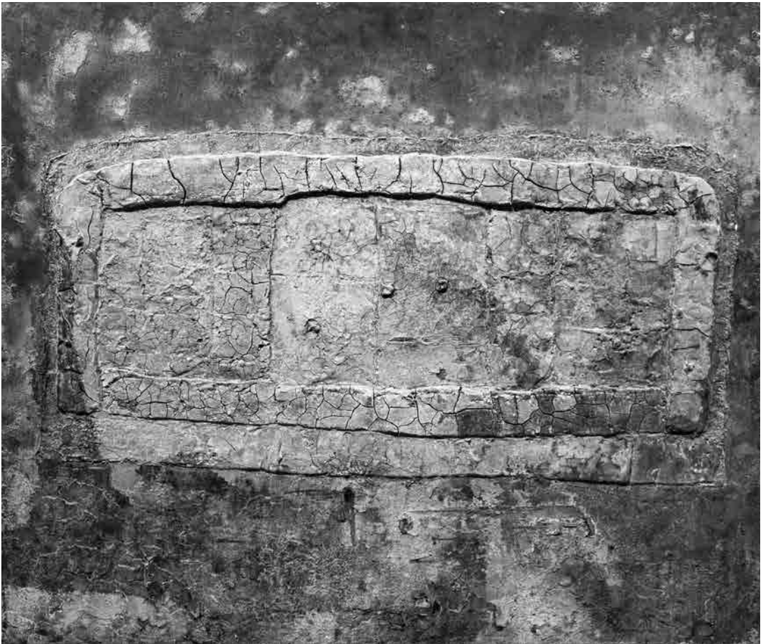
A kék krokodil

– Úgy dobom el, mint a pányvát. Ha ügyes vagyok, szétterül a háló a vízen, mint egy szoknya. A súlyok pedig lehúzzák. Megmutatom, ha kész!