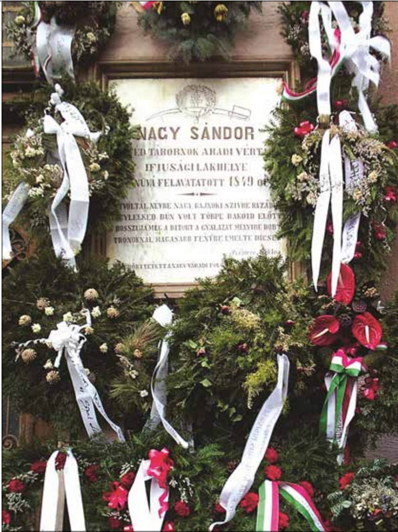
A vértanú születésének bicentenáriumán megkoszorúzott 1873-as nagyvárad emléktábla

pedig egy harcok alatt használt térképet ajándékozott. Ezután Nagysándor fölkérte Vinkler Brunót, hogy a szomszéd cellában lévő Gáspár András tábornokot látogassa meg, és nevében tőle végső búcsút vegyen. Ez meg is történt.