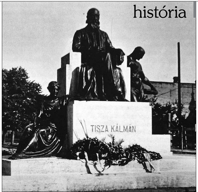
Tisza Kálmán szobrát is felavatták Váradon 80 évvel ezelőtt

A Szent László-hét időtartama alatt egyéb kulturális és sporteseményeket is tartottak.