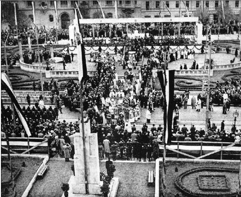
A főtéren tisztelgett a város népe a Szent Jobb előtt