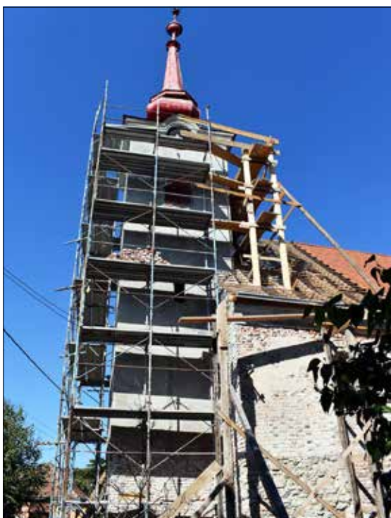
A torony is megújul