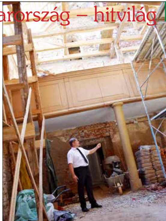
Szép lesz itt minden – bizakodik a lelkipásztor

A templom építése a tiszteletes szerint a XIII. századra tehető, de a pontos ideje nem ismeretes. Jelenleg az ötödik átépítésnek látta hozzá. Az évszázadok során keletről nyugati irányban három átépítést végeztek, egy alkalommal északi irányban, majd északkelet felé bővítettek. A lakosság számának gyara-