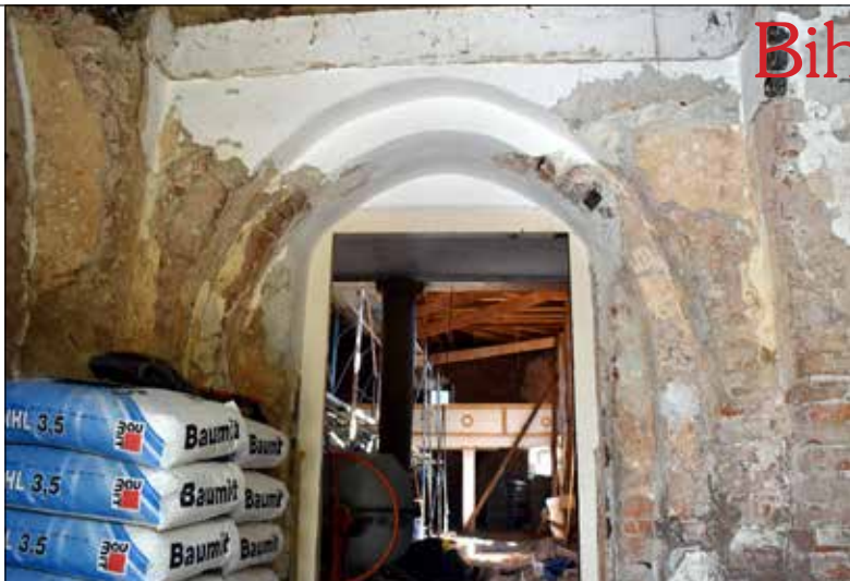
A munkálatok során rátaláltak a középkori bejáratra