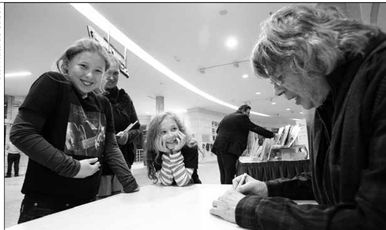
Egy koncert utáni találkozás pillanatai

a megújult gondolkodású közösség jelentésében fogható fel.