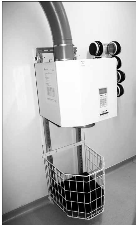
A kórházi csőposta