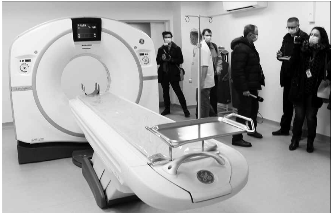
Az új CT

Az új komputertomográfot a Covid-19-járvány kezelésére kiírt, 8,7 millió lej értékű projekt révén szerezték be az intenzív osztályon használatos ágyakkal, videolaringoszkóppal, elektrokardiográffal, monitorokkal, egyebekkel együtt. Ez a projekt idén áprilisban zárul majd. Mint elhangzott, a kórház a saját forrásaiból további 813,1 ezer lejnyi, a váradi önkormányzat támogatásával pedig 558,2 ezer lejnyi beruházást hajtott végre tavaly.