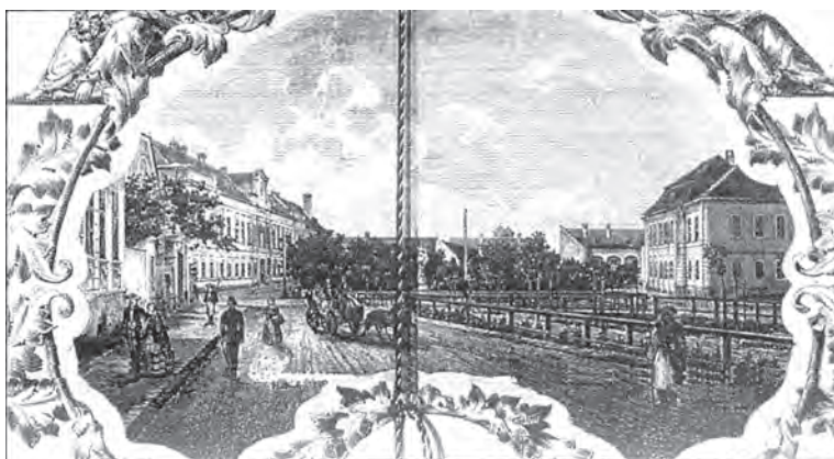
Az illusztráció jobb oldalán az egykori egyemeletes Frimont-palota látható

Az új igazságügyi palota tervét Kiss István (1857–1902) műegyetemi magántanár készítette, aki 1875-től a budapesti műegyetemen tanult, és 1880-ban, Magyarországon elsőként szerzett építész oklevelet. 1876–1880 között a budapesti, IV. kerületi főreáliskolában tanított, majd a műegyetemen tanársegéd, 1885-től magántanár lett. A 19. század második felében sokat foglalkoztatták. Ebben az időben már az igazságügyi paloták tervezésére szakosodott. Ő tervezte a nagy-