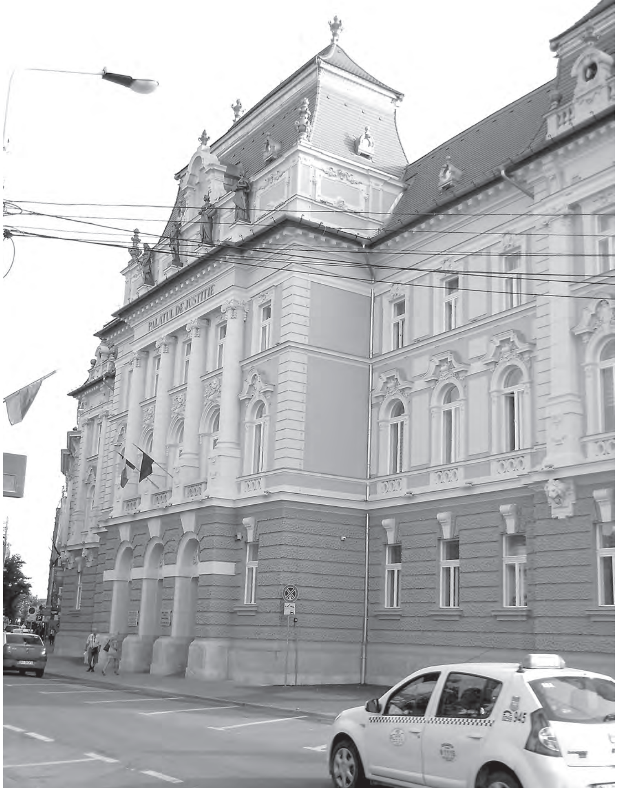
A példásan felújított igazságügyi palota napjainkban