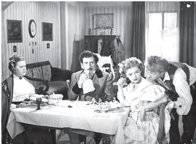
Balázs Samu váradi pályatársával, Dayka Margittal, a szintén váradi Szigligeti Ede Liliomfi jából készült filmben (1954, Krencsey Mariann-nal és Darvas Ivánnal)

Miután bátyja, a Balázs család elsőszülött gyermeke a kor rettegett gyermekbetegségében, torokgyíkban elhunyt, a szülők, orvosi tanácsra, „kiköltöztek” Erdélyből: Nagyváradra, Balázs Samu anyai nagyszüleinek a házába, a Sztaroveszky (ma Magheru) utcába. Mint minden itteni gyermek, ő is megtanulta, hogy Várad a múltban Szent László és Páz-