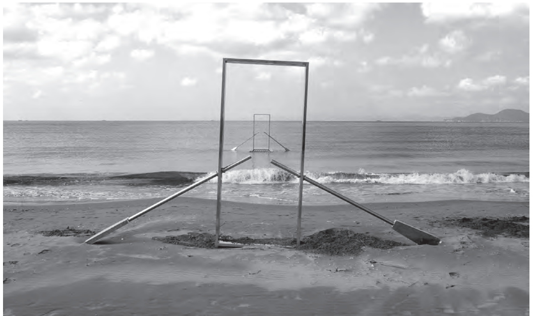
Az emlékezet perzisztenciája, helyszín: Dadaepo Beach, Busan City, Dél-Korea, 2015. szeptember, 2000 × 500 × 300 cm, rozsdamentes acél