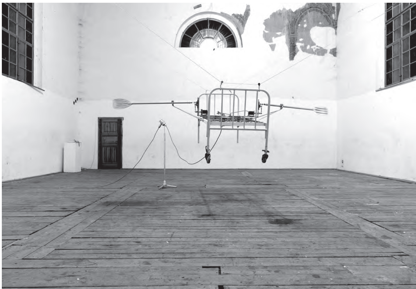
Desert Inn, helyszín: Kis Zsinagóga Galéria, Eger, 2012. március, 1200 × 1200 × 600 cm, rozsdamentes acél, alumínium, vas, teflon, papír, evezők, hordágy, fűrógép, számítógép, képernyő, propeller, hangfalak, hamutartó, elektronika, kábelek, papír zsebkendő csomagolás, aranyfüst