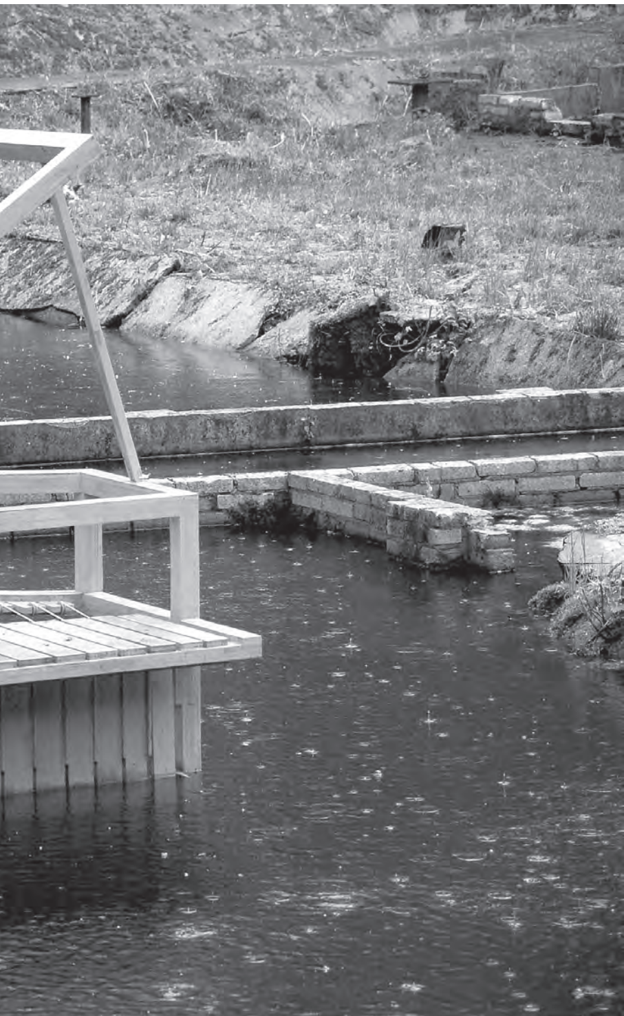
Csendzóna, helyszín: Waterloopbos, Hollandia, 2012. május, 300 × 200 × 250 cm, fa, köté, vas, víz