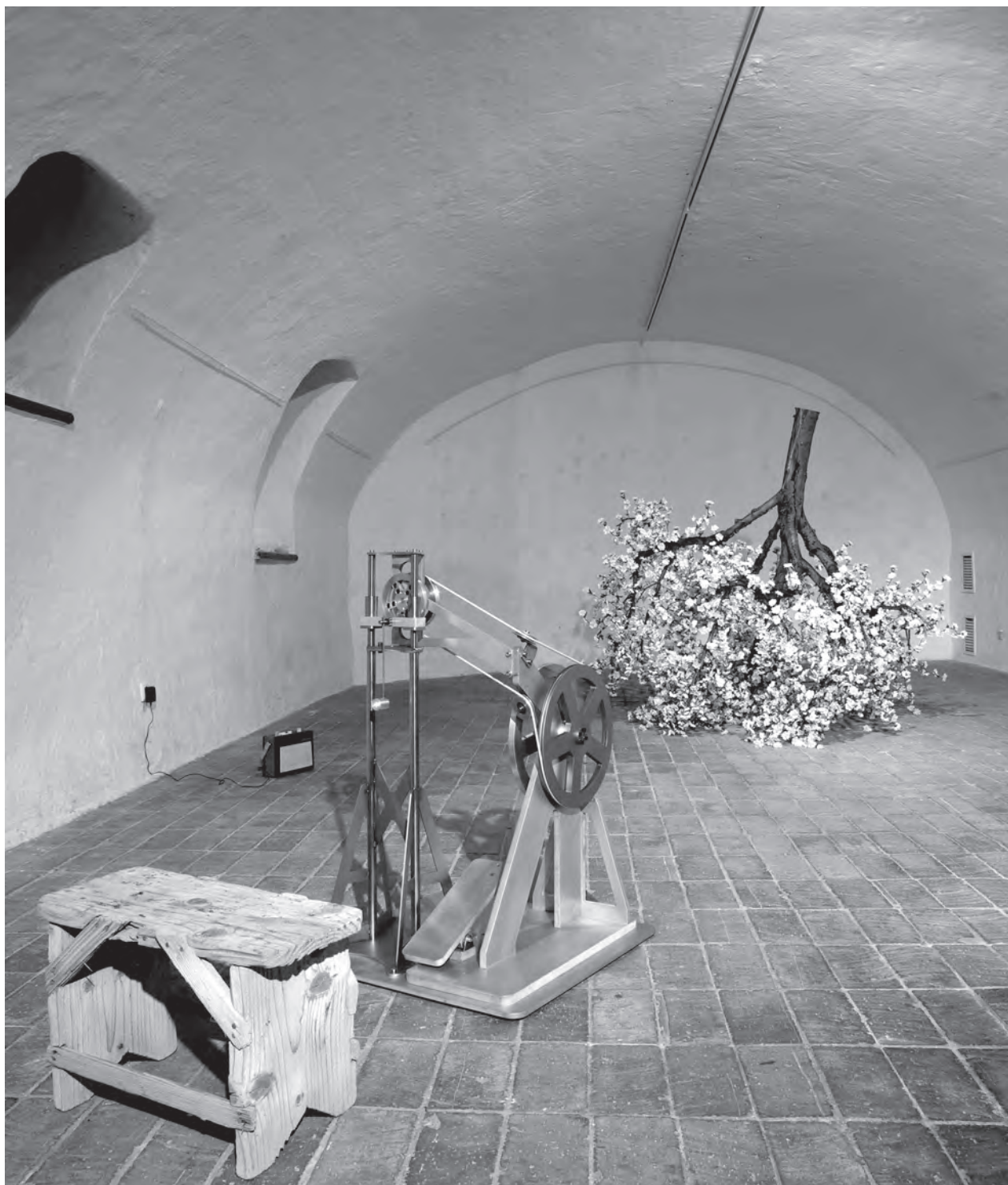
A favágó hobbija, helyszín: Óbudai Társaskör Galéria, Budapest, 2015. május, installáció, 600 × 650 × 180 cm, rozsdamentes acél, fa, táskarádió, művirág, elektronika