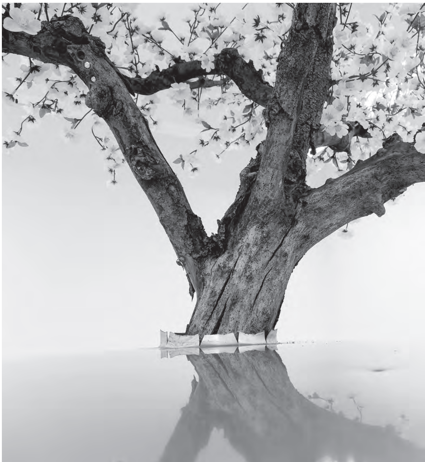
Joyride, részlet az installációból