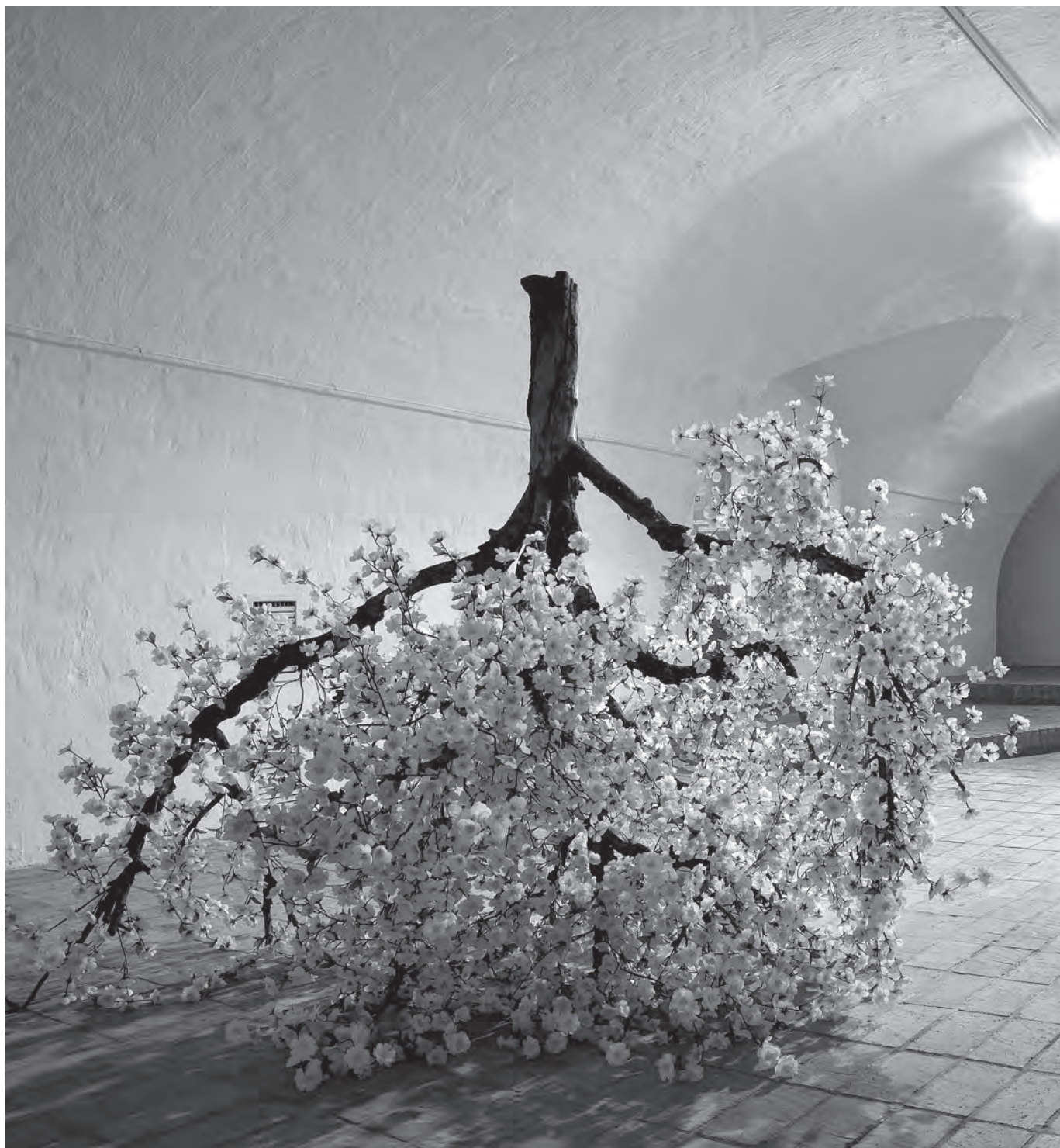
A favágó hobbija, helyszín: Óbudai Társaskör Galéria, Budapest, 2015. május, installáció, 600 × 650 × 180 cm, rozsdamentes acél, fa, táskarádió, művirág, elektronika