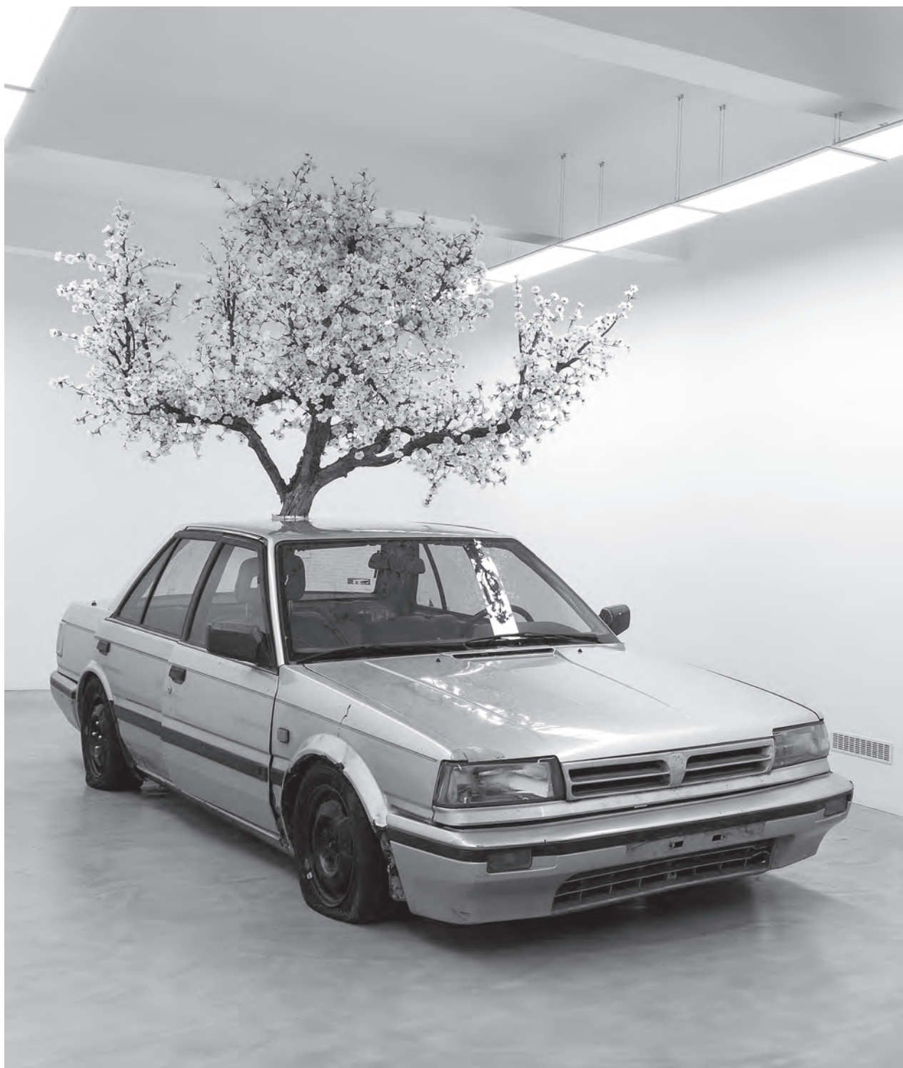
Joyride, helyszín: Horizont Galéria, Budapest, 2016. január, installáció, 500 × 180 × 300 cm, vas, fa, művirág