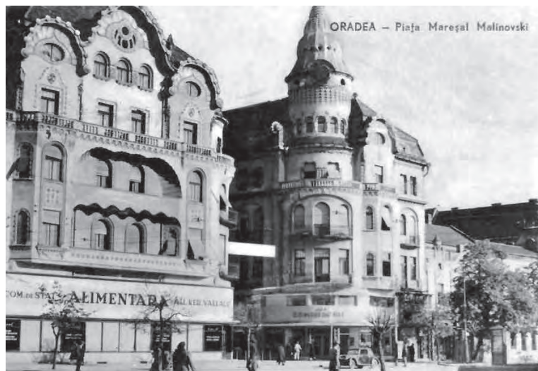
A Fekete Sas palota főhomlokzata