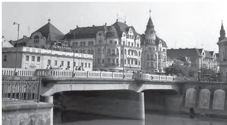
Az ideiglenes fahíd. Háttérben a kiégett városháza

működött benne, a város legnagyobb és legszebb filmszínháza, Puskin néven. Egészen kisgyermek voltam még, amikor előadásokat is tarthattak ugyanitt. Egy balettre emlékszem mindössze, talán a neve miatt: Vörös pipacs . Csak most néztem utána, s tudtam meg, egy Glier nevű szovjet komponista írta a zenéjét a szocialista realizmus jegyében. Többi emlékem inkább az itt látott filmekhez kötődik.