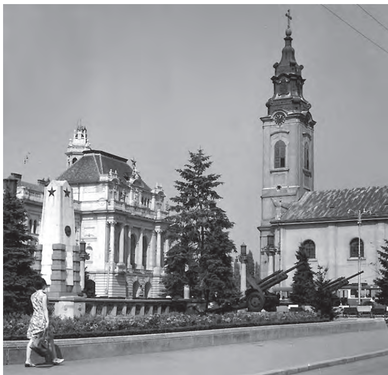
Újváros főtere az ágyús emlékművel