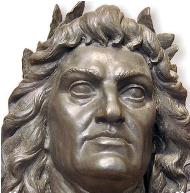
Mátyás király a Fadrusz szobron