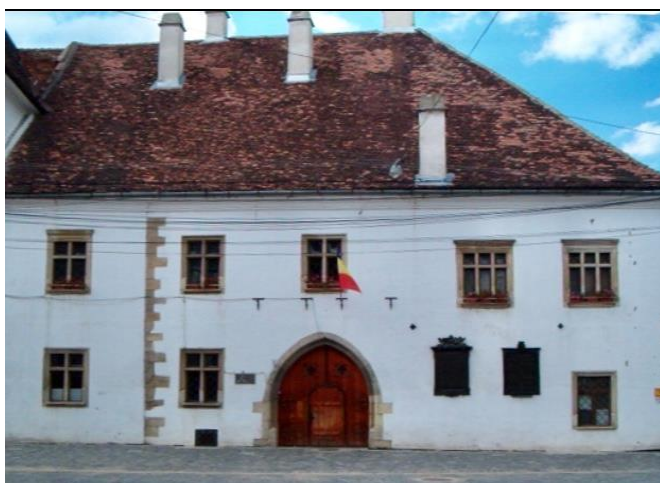
Mátyás király szülőháza Kolozsváron

ó Éljen Mátyás az igazságos! ó harsogta Kinizsi Pál és a stilizált várfok alól a kolozsvári Fadrusz emlékm vét körbe-