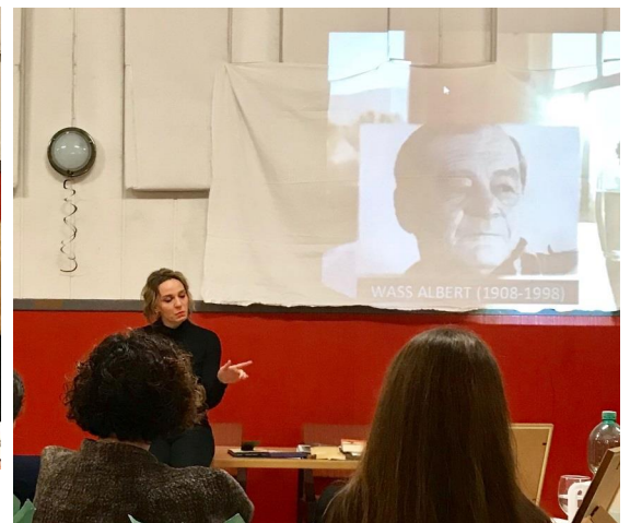
Képek az el adásból