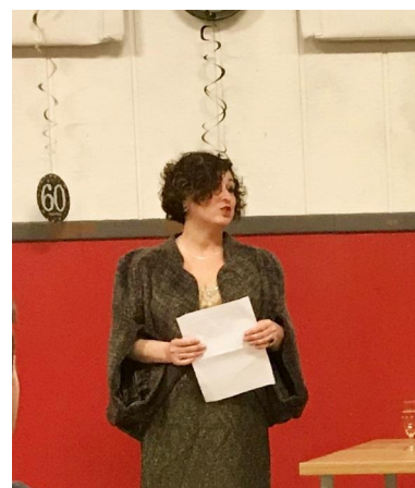
Köszöntőt mondtak: A SMOSZ elnöke, A Magyar Köztársaság stockholmi nagykövete és a LKF elnöke

A Lundi Magyar Kulturfórum fennállásának 60. évét 2017. december 9-én nem kis előkészület után méltón megünnepelték. A klub fennmaradásáért, működéséért minden egyes évben sok nehézséget kellett legyőzniük a közreműködőknek, különösen a vezetőknek. A Svédországban működő szervezetek elnökei és vezetőségi tagjai mindannyian önkéntesen végzik gyakran áldozatos, lemondással járó munkájukat.