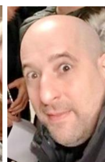
Az előadás szereplői