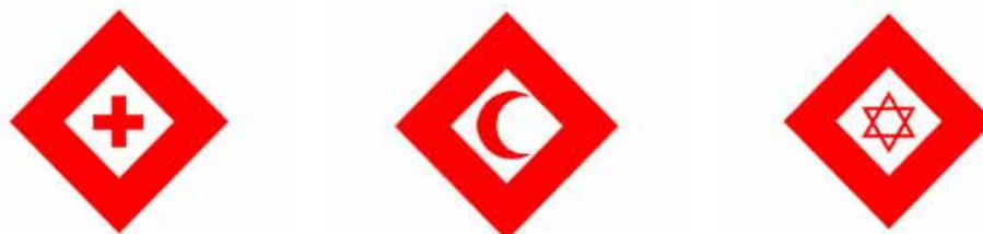
Jelvények kombinált alkalmazása a 3. cikk alapján

a III. Jegyzőkönyv elfogadását megelőzően. Nem lehet szó nélkül elmenni amellett, hogy a hivatalos magyar fordítás a „Vöröskereszt Nemzetközi Bizottsága” elnevezés helyett – valószínűleg tévedésből – „Nemzetközi Vöröskereszt Bizottsága” elnevezést szerepeltet. E szabály elsődleges címzettjének az izraeli nemzeti társaság, a Magen David Adom tünik, amely az új embléma elfogadásával 2006. június 22-én teljes jogú tagjává válhatott a Nemzetközi Vöröskereszt és Vörös Félhold Mozgalomnak. Az előírás megfelelő alkalmazásával lesz lehetséges majd az emblémák kombinált alkalmazása.