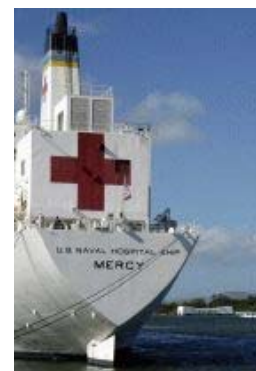
USNS Mercy