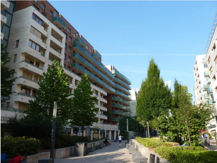
1. kép A Corvin-sétány.

Az interjúkban a VIII. kerületet többnyire egy sokszínű városrészként jellemezték. A leggyakrabban az életkort, a nemzetiségi és etnikai hovatartozást, az életstílust, az anyagi helyzetet és a munkaerőpiaci helyzetet emelték ki, mint a különbségek dimenzióit. Józsefvárost a városrehabilitáció következtében egy gyorsan változó területként írták le, ahol sok belföldi és külföldi beköltöző, bevándorló él. A leggyakrabban említett csoportok: problematikus vagy fenyegetőnek tartott emberek, bevándorlók és új beköltözők, szegények, valamint a régóta a kerületben élők, ezen belül különösen a nyugdíjasok, idősek.