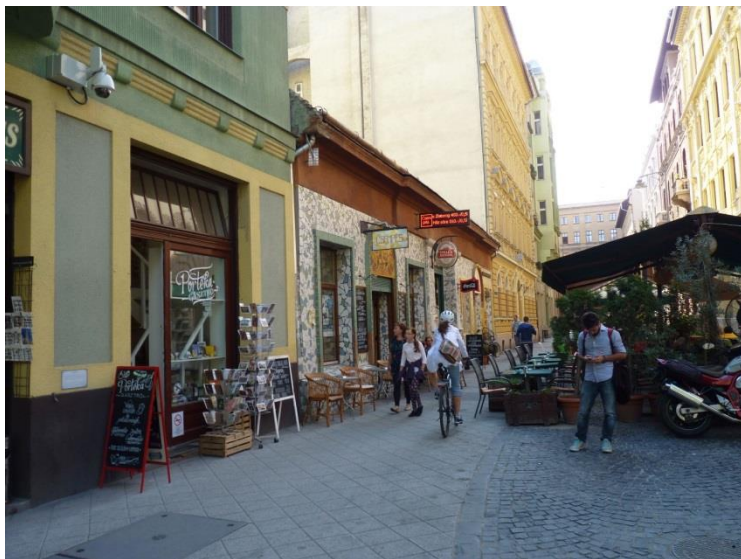
2. kép Új szolgáltatások, vendéglátóhelyek a Palotanegyedben.

„Kevés közterület van. Ugye a legelső az a Múzeum kert, azt rendszeresen használjuk. [...] Gutenberg téren van az egyetlen játszótérünk. Kis szerény, de van. Azt már kétszer felújították, úgyhogy viszonylag jó állapotban van. És a többi azok a sétálóutcák, és egyéb kisebb részek, amik meg nagyon nem működnek közterületként, hát a terek, ahol külön vendéglátó egységek vannak, Mikszáth tér és társai ilyen helyek. Egy-egy fesztiválkor nagyon jól működnek.” (R22, férfi, 48 éves, építész)