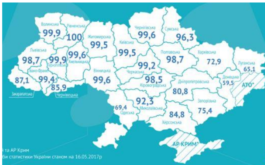
2. térkép Az ukrán tannyelvű iskolák aránya Ukrajna megyéiben (2017) 46

térkép) Az adatokat annyiban kell pontosítanunk, hogy az államnyelvű, azaz ukrán tannyelvű iskolákba beleszámítják nem csak a tisztán ukrán, hanem az ukrán és egyéb tannyelvű iskolákat is. Bár az utóbbiak aránya nem jelentős, azért némiképp mégis torzítja a képet a részletesebb adatok hiánya.