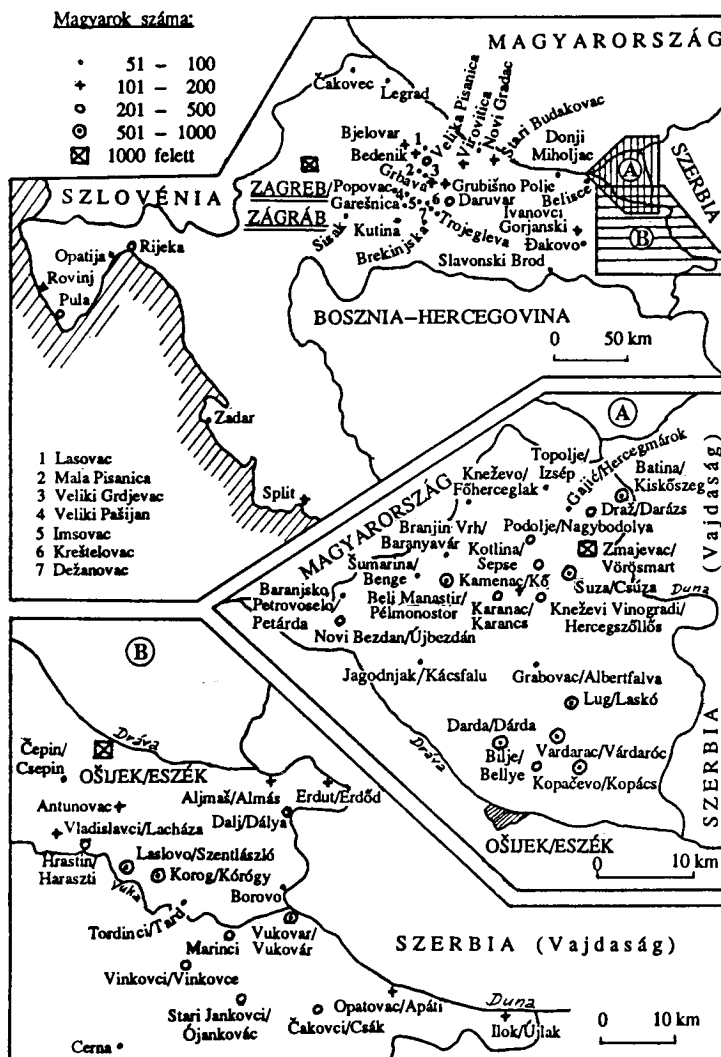
A magyarlakta települések Horvátországban 1981-ben