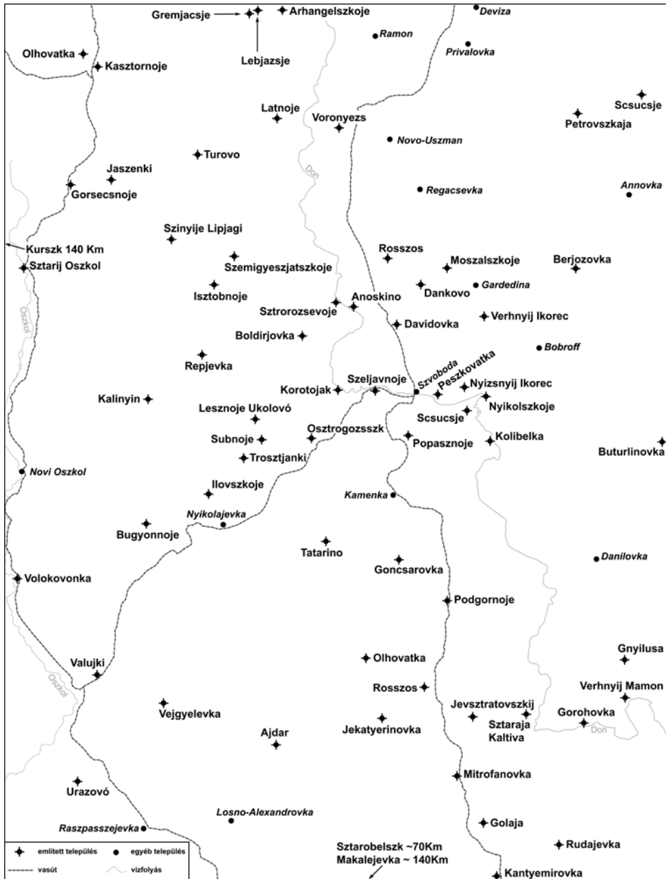
1. térkép: A Voronyezsi Front területe (Csákvári Kristóf)