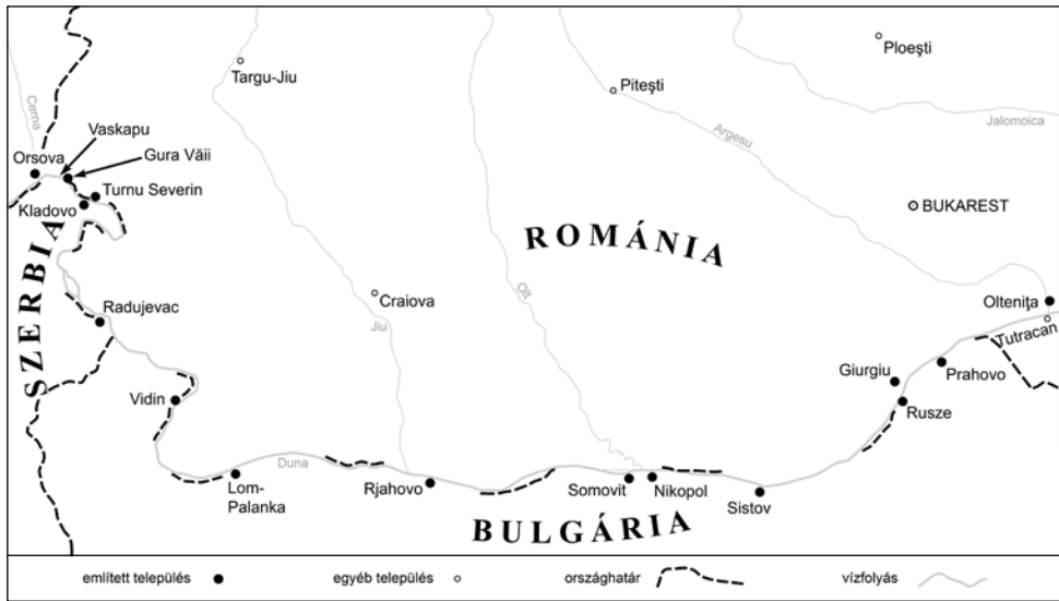
2. térkép: A román–bolgár határt alkotó Al-Duna-szakasz 1915 őszén (Csákvári Kristóf)

miatt Lomon túl kellett szállítani, és Sistovban (Szvisov), illetve Ruszéban kirakni. Az útról Charles Masjon fregattkapitány, a II. monitorosztály parancsnoka részletes jelentés készített. 130 Miután e jelentés plasztikus részletességgel írja le az al-dunai helyzetet, valamint diplomáciai vonatkozású érdekességei is vannak, ezzel az úttal némileg részletesebben foglalkozunk.