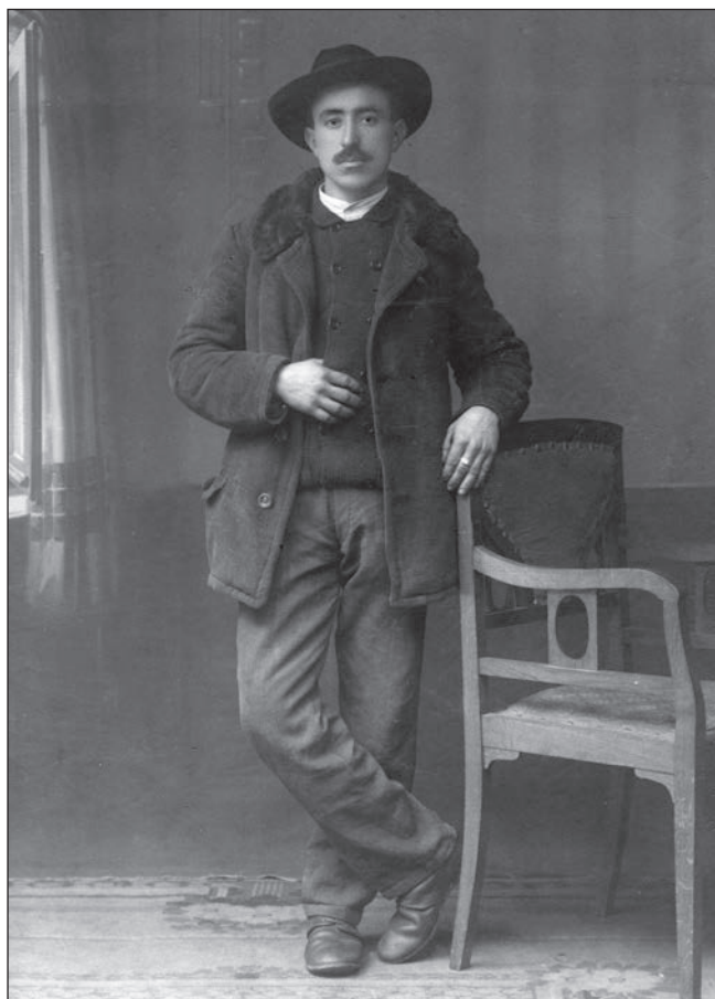
Szerb hadifogoly Dunabogdányban 147

Györgyey Illés 1917 elején úgy ítélte meg, hogy a hadvezetés szűkmarkúan mérte a foglyok öltözetét. A javításhoz szükséges alapanyagok beszerzése rendkívüli nehézségekbe ütközött. 148 Soltvadkerten a késedelmes ruhapótlást panaszolták az egykori antant katonák. 149 A nehézségek orvoslására a Földművelésügyi Minisztérium elrendelte, hogy a munkaadók a hiányzó ruhadarabokat saját költségen szerezzék be a náluk alkalmazott hadifoglyoknak, amelyért a sereg előre meghatározott összegű térítést biztosít majd. 150 Két évvel később azonban a fixált összeg messze nem fedezte a bekerülési költséget. 151 Ekkor azonban már nem csupán a katonai, hanem a polgári lakosság ruháztatása is komoly nehézségekbe ütközött.