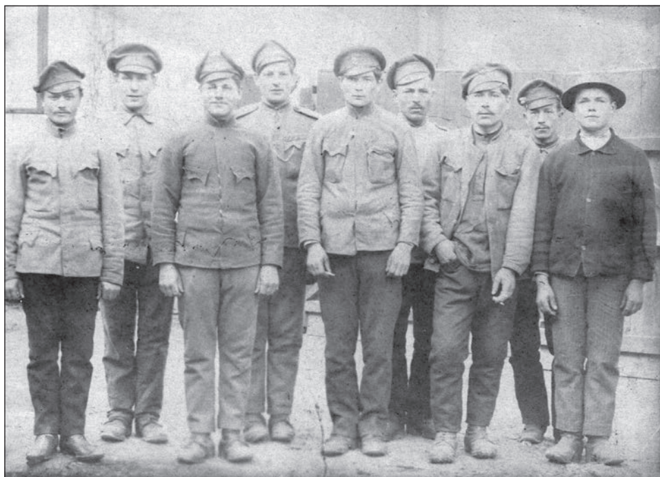
Orosz hadifoglyok Piliscsabán 1918 elején 185