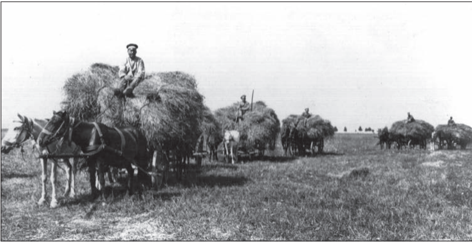
Orosz hadifoglyok Nagykőrös környéki fuvarozási munkán 107