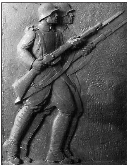
A bal oldali oldalfal egyik domborművének nagymintája (archív)