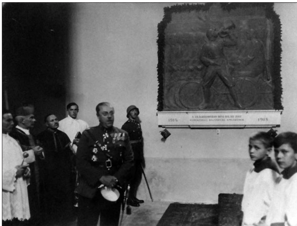
A Kerékpáros hősi emlék avatása a Helyőrségi templomban (archív)