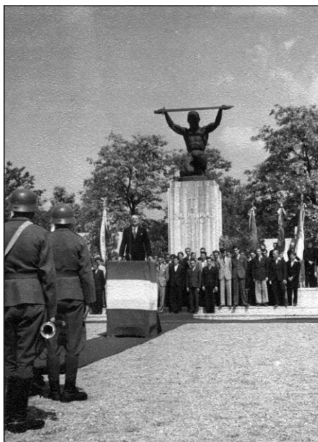
Katonai tiszteletadás a pestszenterzsébeti hősi emlékműnél