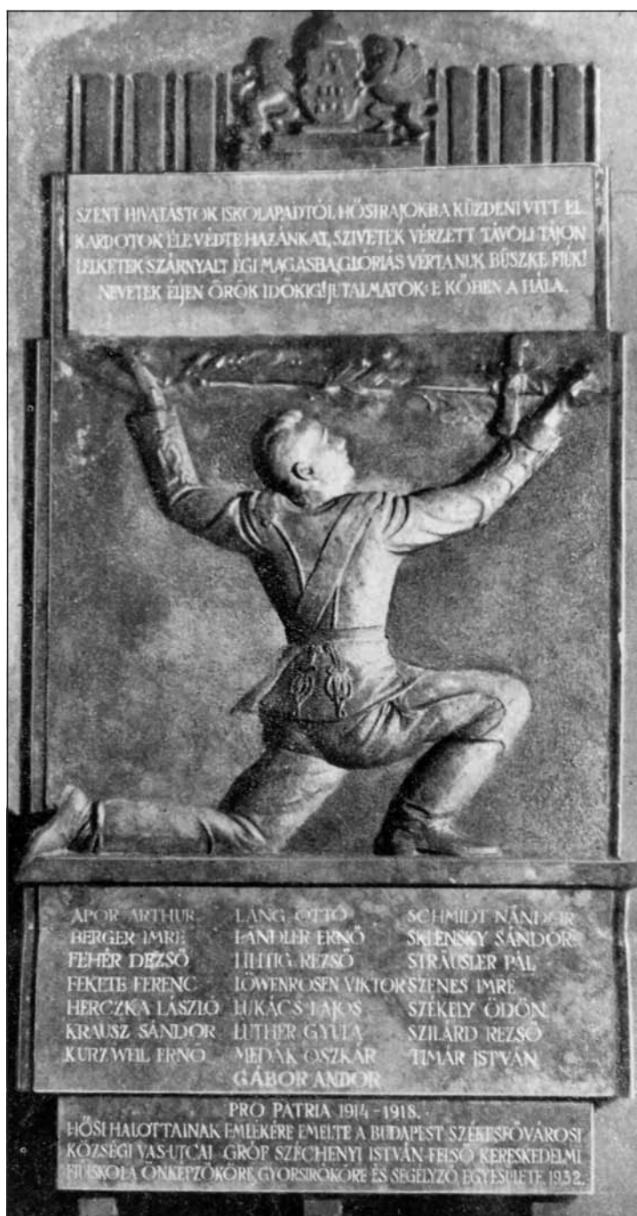
A Vas utcai Felsőkereskedelmi Fiúiskola hősi emlékműve (archív)