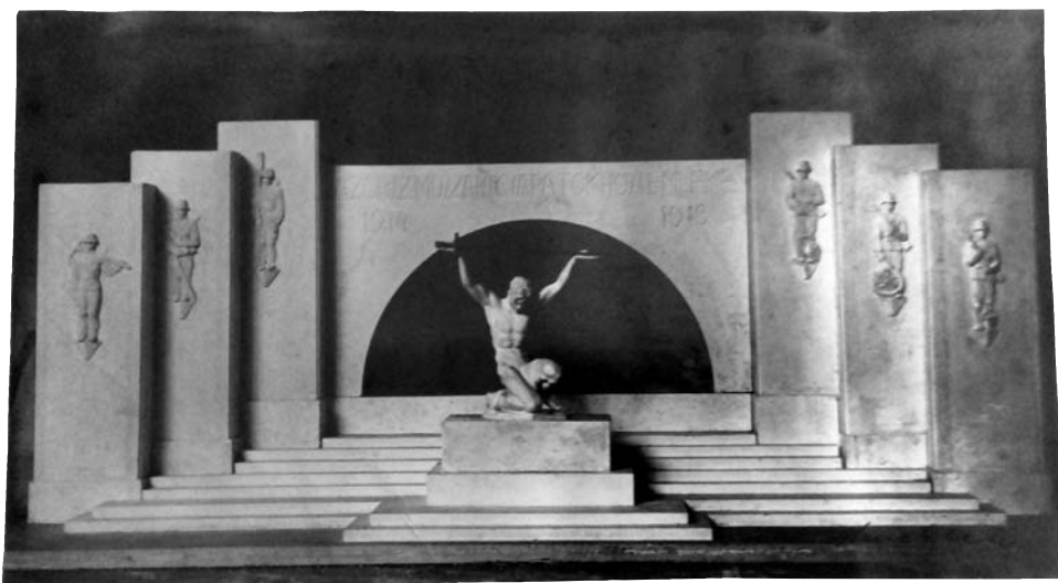
Lux Elek pályaműve a Műszaki csapatok hősi emlékművére (archív)