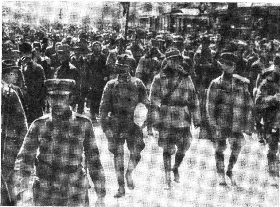
Toborzó felvonulás Budapesten — 1919 tavasza