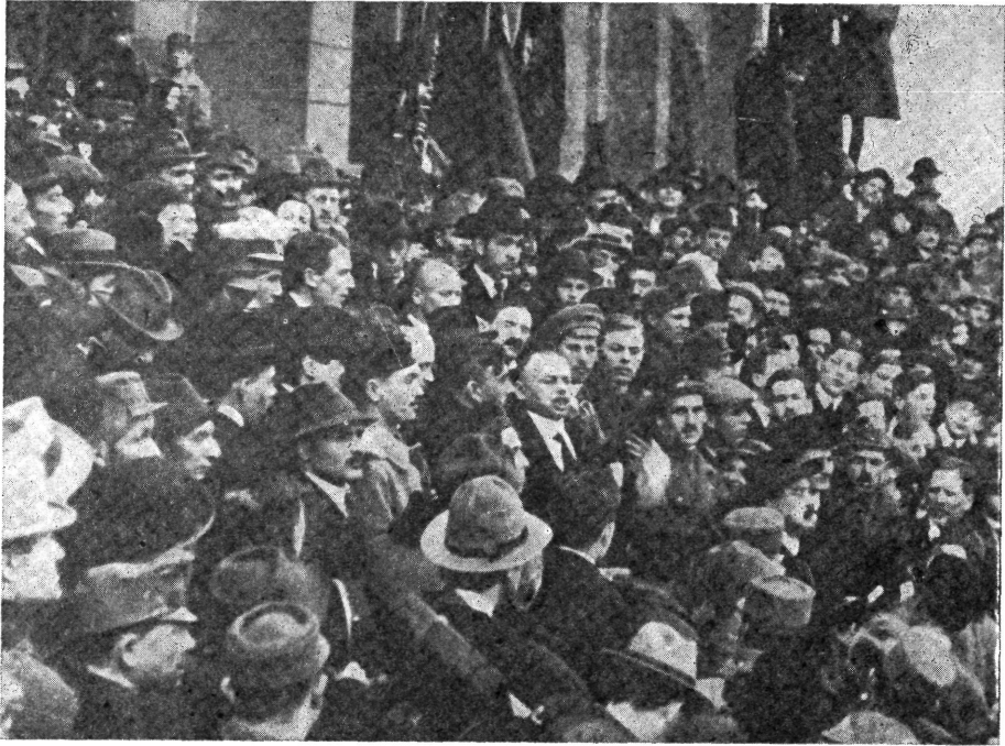
Kun Béla beszél — 1919. március 23.