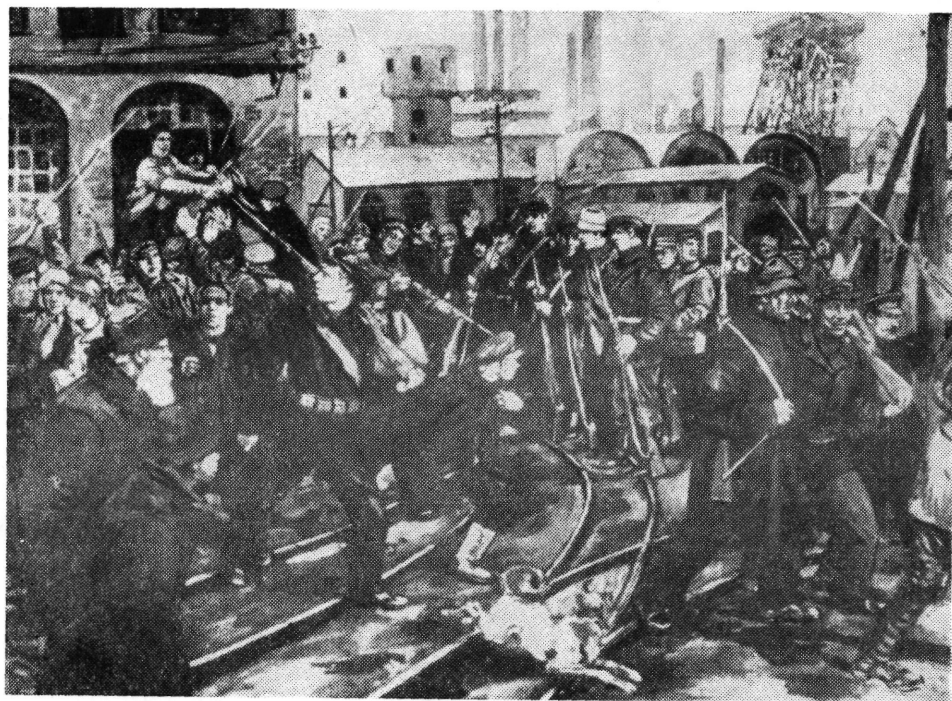
Munkások felfegyverzése a Kornjilov-féle lázadás napjaiban. 1917 augusztus