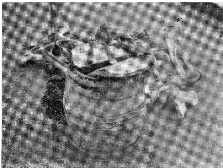
2. sz. ábra. A „Bácska” aknarakóhajó gép- és kazánházának maradványai, egy hordó és evőeszközök