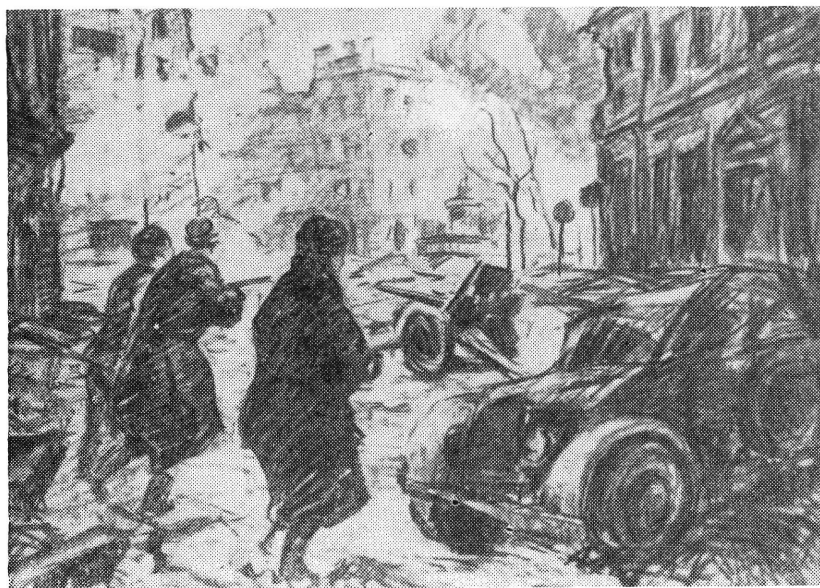
Kálvin téri harcok — 1945.