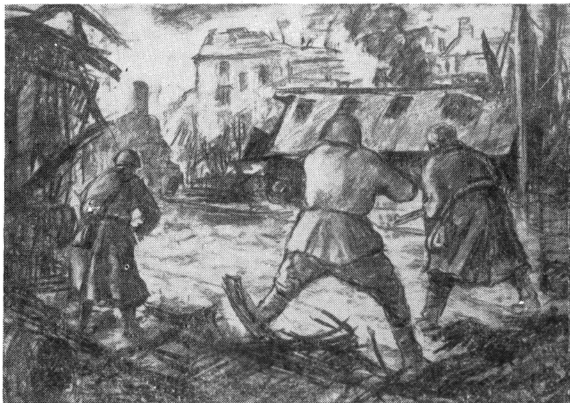
Harc a Déli pályaudvarért — 1945.