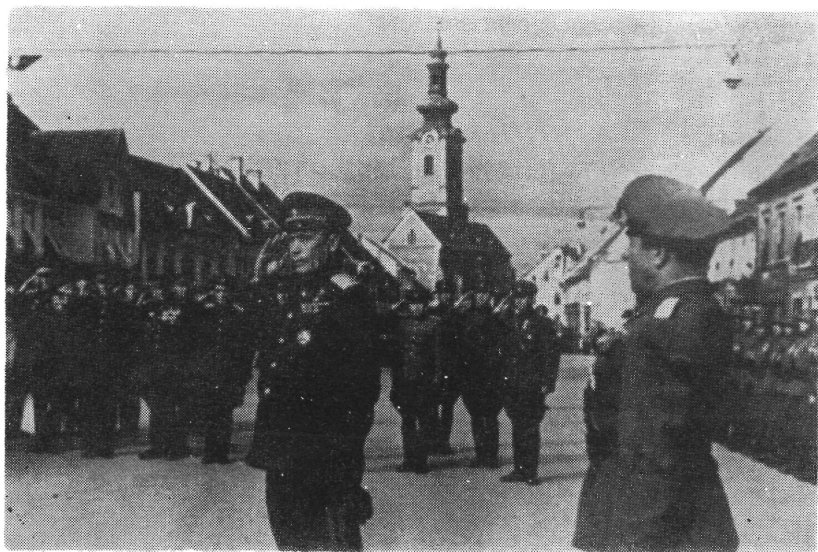
Az 57. Szovjet Hadsereg parancsnoka, Sarohin tábornok köszönti a szovjet és bolgár tiszteket és katonákat. A kép jobb szélén Vladimir Sztojcev altábornagy, az 1. Bolgár Hadsereg parancsnoka áll