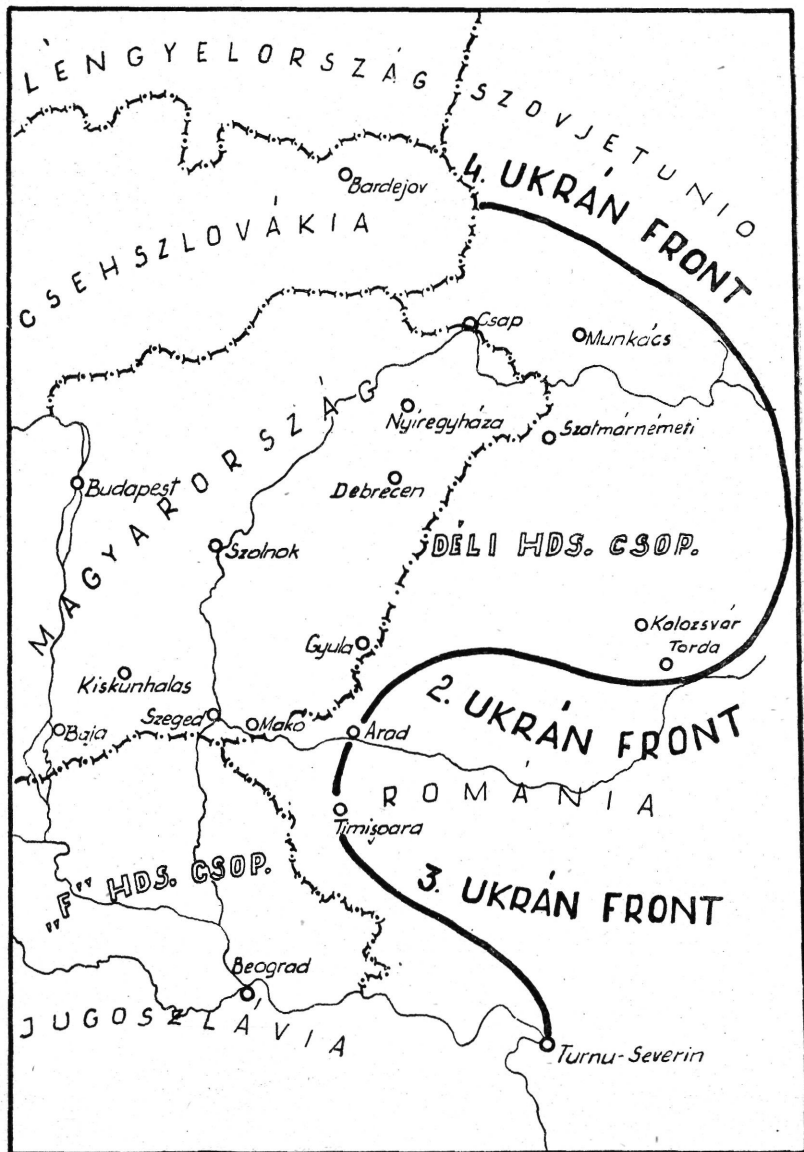
1. sz. vázlat. A déli arcvonal helyzete 1944. szeptember végén.