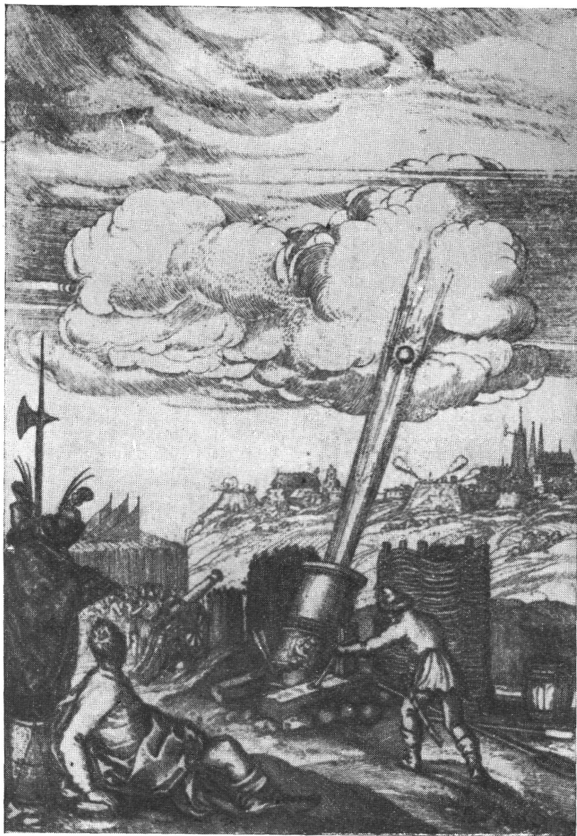
Magyar tüzérség a 17. század első felében.