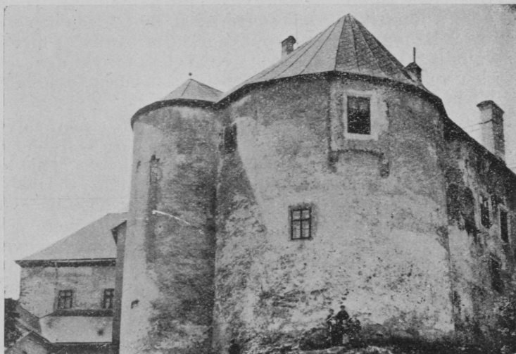
Zólyomlipcse-vára észak felől. (Baloldalán a kápolnabástya).