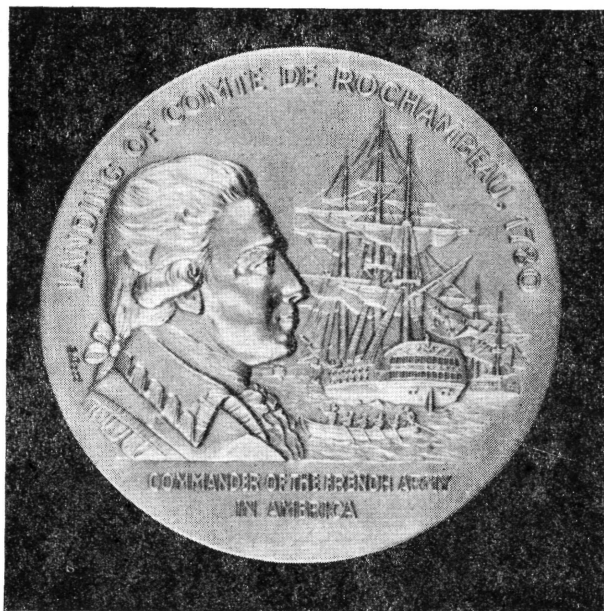
Rochambeau grófjának emlékérmé

Rochambeau dolgozta ki Washingtonnal együtt a Yorktown-i hadmozdulatok terveit és megelőzőleg is, a háború egész folyamán, a kontinentális hadsereg rendelkezésére bocsátotta hadserege mérnök- és tüzérkari tisztjeinek felbecsülhetetlen tapasztalatait.