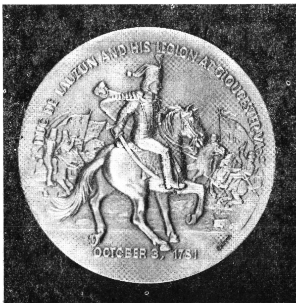
Lauzun herceg emlékérméje

A légiót különleges katonai szolgálatokra alkalmazták, egyik utolsó fegyverténye B. Tarleton ezredes brit dragonyosainak megfutatítása volt Yorktown alatt, 1781. október 3-án. Ugyanebben a hadjáratban Lauzun herceg Rochambeau tábornok személyi összekötő tisztje volt Washington főhadiszállásán.