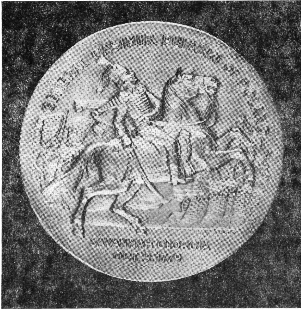
Casimir Pulaski tábornok emlékérmé

melyet a továbbiakban Pulaski Légiónak neveztek, vegyen részt a harccselekményekben. Pulaski Savannah ostromakor 1779. október 9-én halálos sebet kapott és három nappal később meghalt.