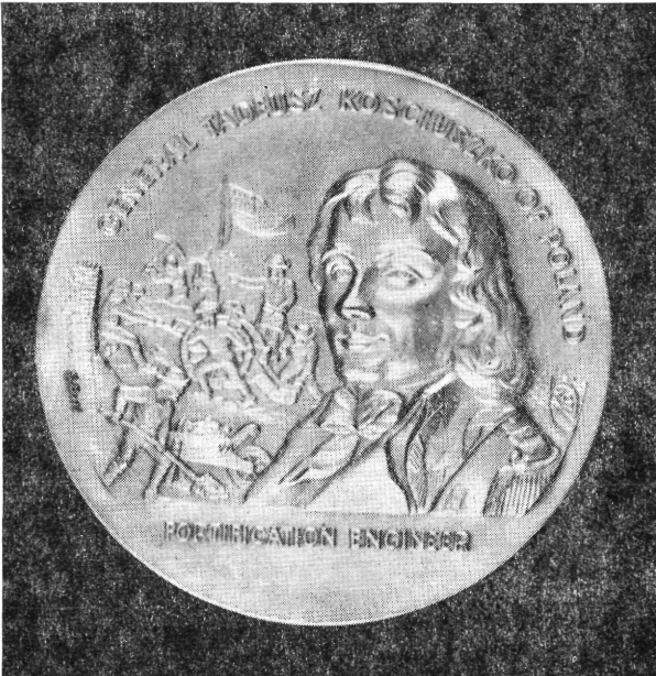
Tadeusz Kosciuszko tábornok emlékérmé

Jobb oldalon a tábornok félprofil mellképe, háttérében erődítési munkálatokat végző amerikai katonák.