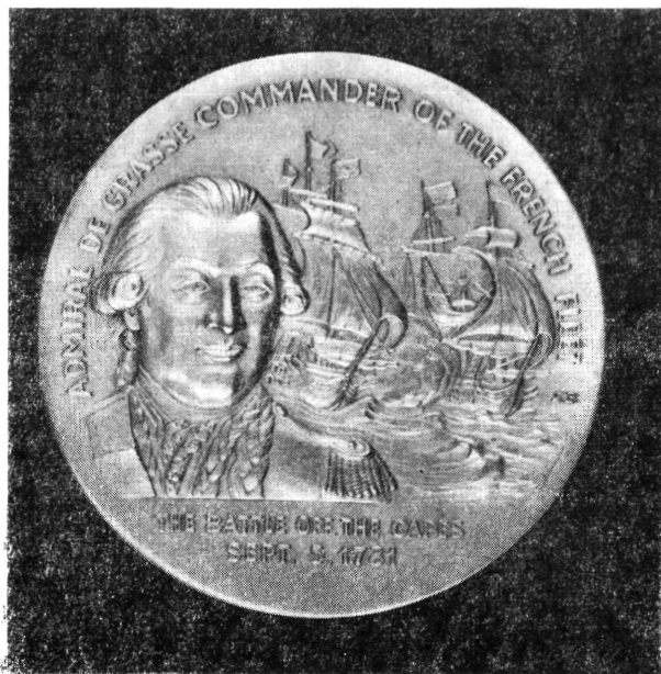
De Grasse admirális emlékérmé

A szelvény felirata: „THE BATTLE OFF THE CAPES SEPT. 5, 1781” (Csata a fokoknál, 1781. szeptember 5.)