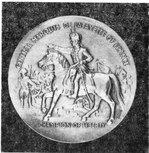
Lafayette márkí emlékérmé