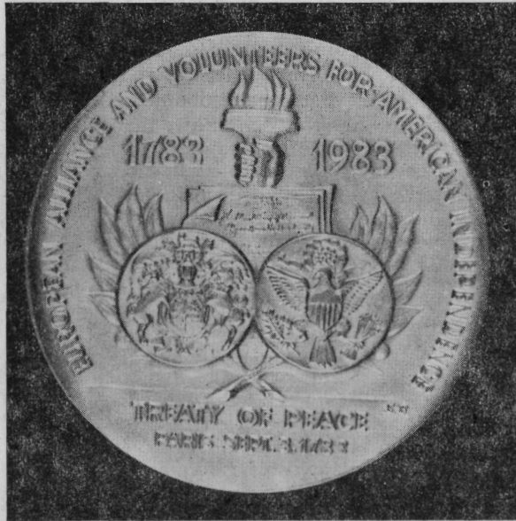
Az érme hátoldala

Az éremképet szintén angol nyelvű körirat keretezi: „EUROPEAN ALLIANCE AND VOLUNTEERS FOR AMERICAN INDEPENDENCE” — „Európai szövetségesek és önkéntesek az amerikai függetlenségért.” Ez a körirat már az alap gondolat kiteljesítésére utal, arra, hogy a művész a nevezetes béke vívmányaihoz vezető nehéz küzdelem európai harcosainak is emléket kívánt állítani.