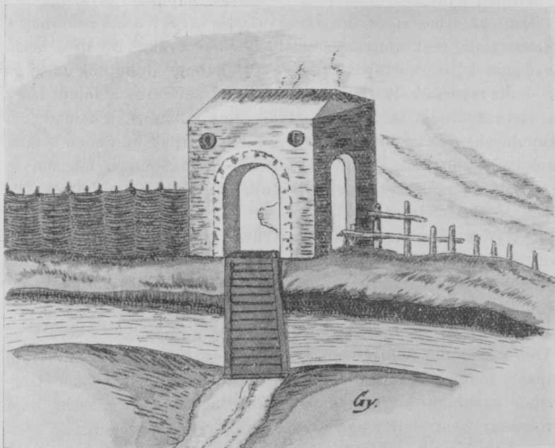
Nagyvárad várának Vadkert kapuja.

Pethő idézett szavai azt mutatják, hogy a rajtaütés végrehajtása körül valami végzetes hiba történt. Kár, hogy nem jegyezte fel, mik voltak azok a parancsok, a melyeknek meg nem fogadása a támadás kudarczát s ezzel együtt Rákóczy László